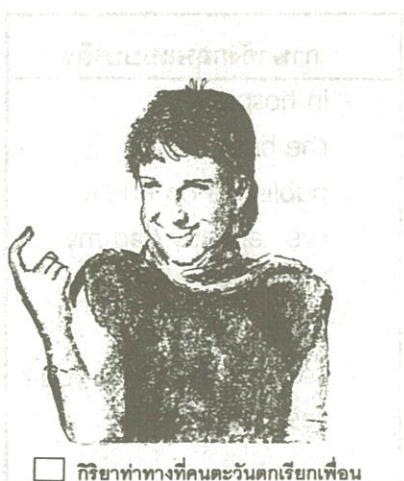
กิริยาท่าทางที่คนตะวันตกเรียกเพื่อน

เนื่องจากภาษาอังกฤษเป็นภาษาที่ใช้เป็นภาษาประจำชาติ และไม่เป็นภาษาประจำชาติ ในหลายประเทศ ดังนั้นภาษาอังกฤษในประเทศต่าง ๆ เหล่านี้มีลักษณะแตกต่างกันไปในแต่ละประเทศตามสภาพแวดล้อม (Stevens 1987;59) ภาษาอังกฤษที่ใช้ในประเทศสิงคโปร์ก็มีเอกลักษณ์เฉพาะออกไป หรือภาษาอังกฤษในอาฟริกาตะวันออกมีลักษณะแตกต่างออกไปอีก ยิ่งถ้าเป็นภาษาอังกฤษในประเทศอินเดีย