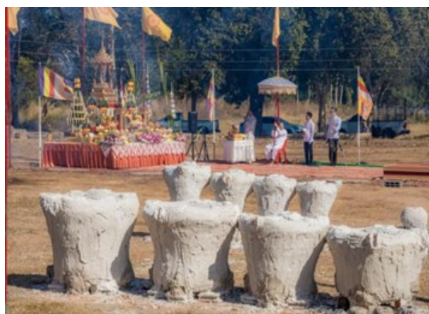
พิธีกรรมในการเททองหล่อพระ ณ วัดพระธาตุศรีจำปามหารัตนาราม อ.พังโคน จ.สกลนคร