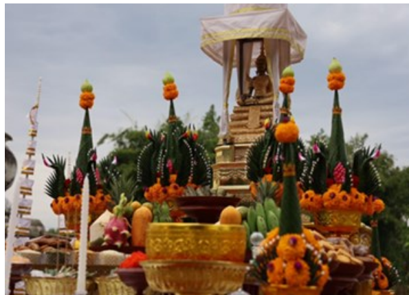
เครื่องบวงสรวงพิธีกรรมการเททองหล่อพระ ณ วัดพระธาตุศรีจำปามหารัตนาราม อ.พังโคน จ.สกลนคร

การจัดพิธีกรรมในการบวงสรวงและขั้นตอนต่างๆในขั้นตอนพิธีกรรมนั้นจะแยกจากพิธีสงฆ์อย่างชัดเจน มีการกำหนดการช่วงเวลาที่แน่นอนโดยผ่านการประกาศหรือแจ้งไว้ล่วงหน้า ในการกำหนดพิธีเททองหล่อพระบาทพระสงฆ์ที่มาร่วมในพิธีจะเททองหล่อพระนั้นจะมีขั้นตอนดังนี้ การไหว้พระ รับศีล สวดชยันโตเมื่อถึงฤกษ์ยามที่กำหนดการเททอง ซึ่งฤกษ์ยามนี้จะได้มาจากการกำหนดให้จากความเชื่อของพระอาจารย์ที่เคารพนับถือหรือพระประธานฝ่ายสงฆ์ โดยขั้นตอนการเททองหล่อพระนั้น จะมีการเตรียมแทนพิธีสำหรับให้ประธานหรือตัวแทนและคณะเจ้าภาพมายืนที่แทนเพื่อหย่อน แผ่นดวง แผ่นทอง หรือ ทองคำแท่งลงในเบ้าเอกและจับสายสิญจน์เพื่อเสมือนหนึ่งว่าได้ร่วมเททองหล่อองค์พระ ส่วนผู้เข้าร่วมพิธีก็จะจับสายสิญจน์ที่โยงไว้ในขณะจัดเตรียมปรมพิธี หรือร่วมตั้งจิตอธิษฐานในการหล่อพระ นอกจากนี้ก็จะมีพระสงฆ์อีก 4 รูป ที่จะเลือกจากทางผู้จัดงานหรือเจ้าภาพนิมนต์มานั่งปรก 4 ทิศ บนธรรมมาศที่มีการจัดเตรียมไว้แต่แรก เมื่อถึงฤกษ์ยามตามกำหนดช่างหล่อพระจะยกเบ้าเอกมายังแทนรับ และนำเบ้าหลอมทองไปเตรียมเท ในช่วงขณะนี้จะใช้เวลาแตกต่างกันไปตามขนาดขององค์พระที่ทำการหล่อ เมื่อทำการเททองเสร็จแล้ว พระสงฆ์ที่เป็นประธานในพิธีจะรดน้ำมนต์หูนองค์พระและโปรยดอกไม้ ถือเป็นเสร็จพิธีการเททองหล่อพระ