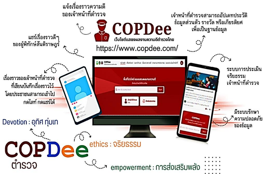
ภาพที่ 2 การออกแบบแพลตฟอร์มการส่งเสริมคุณธรรมและจริยธรรม เพื่อสร้างจิตสำนึกต่อการป้องกันการคอร์รัปชันให้แก่ข้าราชการตำรวจ