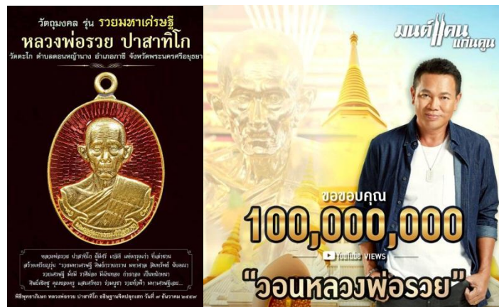
ภาพที่ 1 ภาพลักษณ์ของพระกับการอ้อนวอน/ร้องขอ/พึ่งพิงที่ปรากฏในเพลง (Kapook, 2564)

แนวคิดเรื่องสรรณะตามคติทางพระพุทธศาสนา ถือเป็นหลักการใหญ่หรือแนวปฏิบัติใหญ่ แต่ไม่ได้ยึดถือปฏิบัติ คำว่า สรรณะ ที่แปลว่า ที่พึ่ง ที่ระลึก อันถูกต้องซึ่งประกอบด้วยพระไตรรัตน์ คือ คุณสมบัติของพระพุทธเจ้า คุณค่าแห่งหลักธรรม คุณค่าคุณสมบัติของสงฆ์ ที่ควรจะเป็นกรอบและเกณฑ์สำหรับการปฏิบัติตามคติในทางพระพุทธศาสนา แต่นัยของการถือตัวบุคคล ถือฤทธิ์ การอ้อนวอน-ร้องขอเพื่อความสำเร็จ โดยมีวัตถุประสงค์ผลพลอยได้ ความรวย ถูกหวย ถูกฉลากเป็นเครื่องรับประกัน (Guarantee) ต่อการเช่นสรวง ซึ่งในปรากฏการณ์ทางสังคมนี้ ได้มีกลุ่มคนไปยึดถือ พึ่งพิงและอาศัยเป็นสาระหลัก ทำให้กลายเป็นภาพสะท้อนของสังคมไทยไปในขณะนี้ คนจึงไปวัดหลวงพ่อรวยเพื่อความรวย พึ่งเพลงวอนหลวงพ่อรวยเกิดแรงเร้า ซึ่งนัยหนึ่งเป็นการโฆษณาแฝงเพื่อให้ประสบผลสำเร็จด้วยการทำยอดคนพึ่งให้ได้ 2 ร้อยล้านคน/ครั้งในการเข้าพึ่ง นัยหนึ่งเป็นการปลุกปลอบใจ นัยหนึ่งเพื่อความบันเทิง อีกนัยอาจฉาบทาจิตไปสู่ความอยากรวย อยากมีเงินและร้องขอต่อความร่ำรวย จนกระทั่งกลายเป็นพฤติกรรมหลัก ไม่ทำงาน ไม่ชวนชววย ดิ้นรนและสยบยอมร้องขอจนกลายเป็นสิ่งที่ถูกระทำอย่างต่อเนื่อง ในทางจิตวิทยาอาจเป็นสิ่งที่ดีต่อใจ ในเชิงจิตบำบัดทำให้มีกำลังใจลุกขึ้นได้เพื่อไปต่อ พร้อมสู้ แต่อีกนัยหนึ่งกลายเป็นภาพสะท้อนการพึ่งสิ่งอื่นนอกเหนือตนหรือนอกเหนือพระไตรรัตน์ ในสภาพบ้านเมืองระส่ำ ข้าวยากหมากแพงในช่วงการระบาดของโควิด 19 (COVID-19) เศรษฐกิจชะลอตัวจนกลายเป็นภาวะชะงักงันดังปรากฏในปัจจุบัน จึงต้องตั้งคำถามว่า แล้วสังคมจะไปทางไหนกันดี