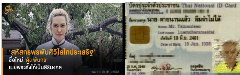
ภาพที่ 3 ตัวอย่าง ความเชื่อกับการตั้งชื่อของคนในสังคม (1) สหัสวรรษพืชมงคลวิไลประเสริฐ (2) นายตายนานแล้ว ลืมจำไม่ได้ (Mango Zero, 2564; Bangkokland Thailand, 2012)

จากหลักฐานแนวคิดทางพระพุทธศาสนาสะท้อนให้เห็นว่า ชื่อเป็นส่วนแนะนำให้คนรู้จักหรือเป็น สัญลักษณ์ แต่ชื่อกลับถูกทำให้เป็นสิ่งบัญญัติที่มีความสำคัญต่อการดำเนินชีวิต ยกตัวอย่างในสังคมไทยดังภาพ ที่ 3 ต่อไปนี้