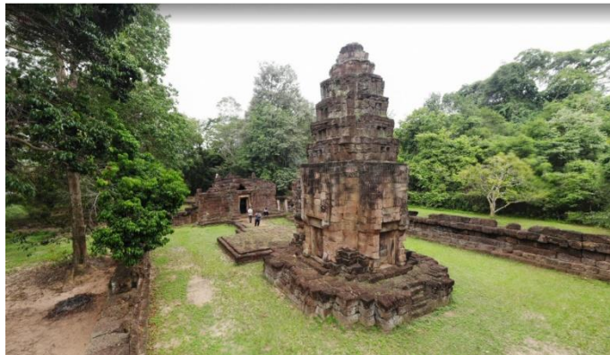
ภาพที่ 4 ปราสาทตาเมือนไต้ (อโรยศาล พระพุทธศาสนาหายาน) จังหวัดสุรินทร์