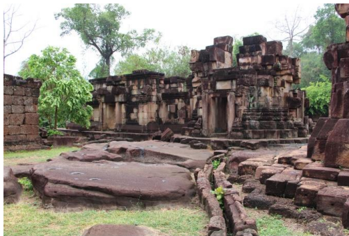
ภาพที่ 1 ปราสาทตาเมือนธม (เทวาลัย ศาสนาพราหมณ์ฮินดู) จังหวัดสุรินทร์

1) เทวาลัย (เทวสถาน) คือ อาคารทรงปราสาทที่ใช้เป็นศาสนสถานในวัฒนธรรมขอมนั้นมีที่มาจากอินเดีย กล่าวคือ ชาวอินเดียได้สร้างปราสาทขึ้น เพื่อประดิษฐานรูปเคารพทางศาสนา เรียกว่า “เทวาลัย” โดยสร้างเป็นอาคารที่มีหลังคาซ้อนขึ้นไปหลายชั้น แต่ละชั้นมีการประดับอาคารจำลองสามารถแยกออกเป็น 2 สายวัฒนธรรม ได้แก่ สายอินเดียภาคเหนือ เรียกว่า “ทรงศิขร” (สิขะ-ระ) คือ ปราสาทที่มีหลังคารูปโค้งสูง ส่วนในสายอินเดียภาคใต้ เรียกว่า “ทรงวิมาน” คือ ปราสาทที่มีหลังคาซ้อนเป็นชั้น ๆ แต่ละชั้นมักประดับอาคาร จำลองจากรูปแบบของปราสาทขอม ในระยะแรกเชื่อกันว่าได้รับอิทธิพลของทรงศิขรจากสายอินเดียภาคเหนือ ส่วนทรงวิมานนั้นได้รับอิทธิพลมาอย่างศิลปะชวา ต่อมาภายหลังช่างขอมได้นำเอารูปแบบทั้ง 2 สายวัฒนธรรม มาผสมผสานกัน จนกลายเป็นรูปแบบเฉพาะของตัวเองขึ้น (โครงการสารานุกรมไทยสำหรับเยาวชนโดยพระราชประสงค์ในพระบาทสมเด็จพระเจ้าอยู่หัว, 2550)