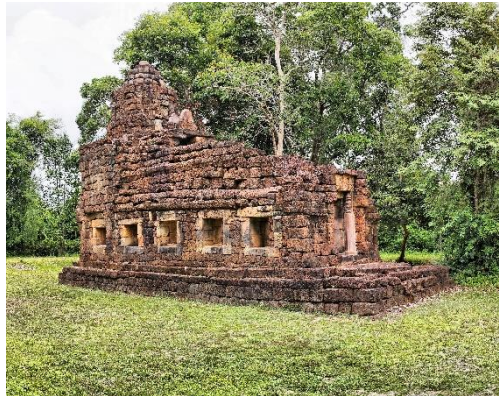
ภาพที่ 2 ปราสาทตาเมือน (ธรรมศาลา พระพุทธศาสนาหายาน) จังหวัดสุรินทร์

2) ธรรมศาลา (ที่พักคนเดินทาง หรือ บ้านมีไฟ) จากหลักฐานทางด้านจารึกทั้งที่พบในประเทศไทยและดินแดนประเทศไทย ข้อความตอนหนึ่งในจารึกปราสาทพระขรรค์ในประเทศไทย กัมพูชา กล่าวว่า “พระเจ้าชัยวรมันที่ 7 ได้ทรงสร้างพระชัยพุทธมหานาถอันเป็นพระพุทธรูปฉลองพระองค์ไปไว้ในพระวิหาร ที่อยู่ในดินแดนของพระองค์จำนวน 23 แห่ง” ซึ่งวิหารเหล่านี้ นักวิชาการเชื่อว่า บางแห่งน่าจะตั้งอยู่ในภาคกลางของประเทศไทย เพราะเหตุว่าร่องรอยของชื่อและหลักฐานทางด้านโบราณสถาน สอดคล้องกับข้อความในจารึก หรือข้อความจากจารึกที่กล่าวถึงการสร้าง “ที่พักพร้อมไฟ” ซึ่งเรียกกันภายหลังว่า “ธรรมศาลา” จำนวน 17 แห่ง บนเส้นทางจากเมืองพระนครหลวงไปยังเมืองวิมาย (พิมาย)” จังหวัดนครราชสีมา ที่เรียกว่า “ราชมรรคา” ก็ได้มีการค้นพบธรรมศาลาตามเส้นทางที่ระบุไว้ในจารึกแล้วบางแห่งในประเทศไทย (สำนักพิพิธภัณฑสถานแห่งชาติ กรมศิลปากร กระทรวงวัฒนธรรม, 2550)