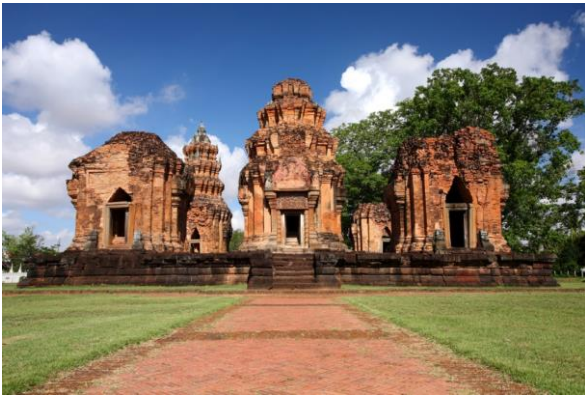
ภาพที่ 5 ปราสาทศีขรภูมิ (เทวาลัย) บ้านปราสาท ตำบลระแงง อำเภอศีขรภูมิ จังหวัดสุรินทร์

พิสมัย ดิศกุล) เคยเสด็จเยือนในช่วงเดือนมกราคม-กุมภาพันธ์ พ.ศ. 2472 (ตรงกับ พ.ศ. 2473 ตามการนับปีปัจจุบัน) และต่อมาได้ถูกรวมอยู่ในเขตอุทยานประวัติศาสตร์กลุ่มปราสาทตาเมือนและปราสาทศีขรภูมิ (สมมาตร ผลเกิด, 2529)