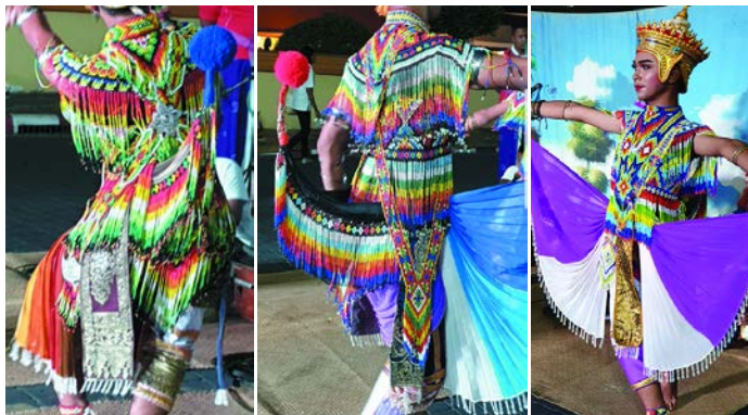
ภาพที่ 1 การแสดงของนักแสดงโนรา และลวดลายของเครื่องแต่งกายโนรา จังหวัดนครศรีธรรมราช

การสร้างสรรค์ผลงานจิตรกรรมร่วมสมัยด้วยวิธีการจุดชุดสีเส้นและลวดลายจากเครื่องแต่งกายโนราได้นำสีเส้นและลวดลายจากเครื่องแต่งกายโนราจากนักแสดงโนราในจังหวัดนครศรีธรรมราชและจังหวัดพัทลุงมาสร้างสรรค์เป็นผลงานจิตรกรรมร่วมสมัยด้วยวิธีการจุดจากกรวย ผู้วิจัยได้ศึกษาการใช้สีจากชุดแต่งกายโนรา สีที่นำมาใช้ล้วนมีความสดใสของสีโดยไม่ได้ลดค่าของสีลงมากนัก การประกอบกันของสีบนลวดลายและรูปทรงได้ใช้สีในวรรณะร้อนและวรรณะเย็นประกอบอยู่ในลวดลายรูปทรงเดียวกัน เพื่อให้เกิดความงามที่เหมาะสมไม่เกิดความเบื่อหน่ายในลวดลายนั้น ๆ อีกทั้งยังทำให้สีที่นำมาใช้เกิดพลังในลวดลายและรูปทรงนั้น ๆ เมื่อนำสีทั้งสองวรรณะมาผสมผสานกันในสัดส่วนที่เหมาะสม ความมีลักษณะเฉพาะของเครื่องแต่งกายอีกรูปแบบคือชิ้นส่วนต่าง ๆ สามารถแยกออกจากกันได้ และนำมาประกอบเป็นรูปทรงเครื่องแต่งกายบนกายวิภาคของนักแสดง ทำให้ขณะแสดงเส้นและรูปทรงที่ร้อยด้วยลูกปัดตามชิ้นส่วนต่าง ๆ มีความเป็นอิสระเคลื่อนไหวและพลิ้วไหวไปตามจังหวะของท่ารำในการแสดงของนักแสดง สีเส้นและความพลิ้วไหวเหล่านี้ช่วยดึงดูดความสนใจของผู้ที่ได้ชม เมื่อนำมาสร้างสรรค์เป็นผลงานด้านจิตรกรรมโดยใช้สีอะคริลิกกำหนดจุดเม็ดเล็ก ๆ ด้วยกรวยแทนลูกปัดเรียงเป็นสี เป็นเส้นเป็นลวดลาย และรูปทรงต่าง ๆ เพื่อแสดงเอกลักษณ์เฉพาะให้คงอยู่ในผลงานจิตรกรรม