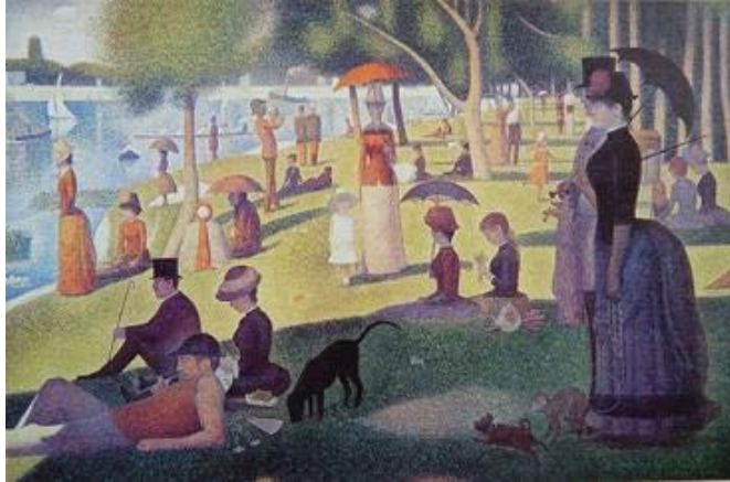
ภาพที่ 3 Seurat “Sunday Afternoon on the Island of La Grande Jatte” (1884-86)