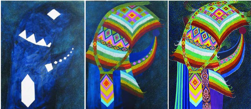
ภาพที่ 7 ขั้นตอนการสร้างสรรค์ผลงานขั้นที่ 2