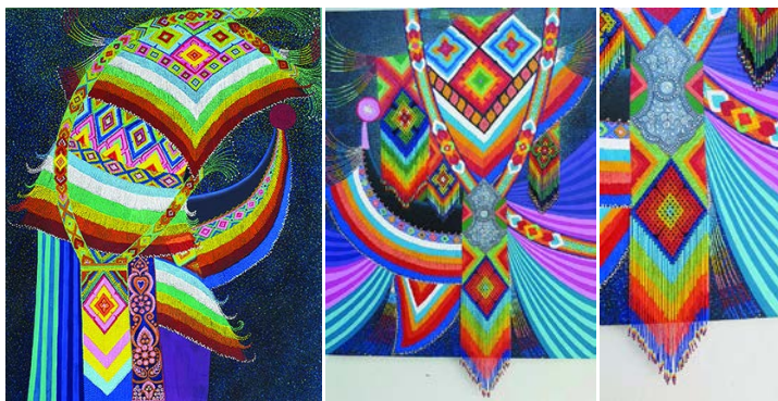
ภาพที่ 9 ผลงานเสร็จสมบูรณ์ขั้นที่ 2 ผลงานเสร็จสมบูรณ์ขั้นที่ 8 และภาพขยายวัสดุลูกปัดจริงขั้นที่ 8

ปัญหาที่ 3 การเคลือบสี ผู้วิจัยต้องการให้สีมีความสดใส การเคลือบสีอีกครั้งเพื่อความมันวาว จึงมีความจำเป็นในการสร้างสรรค์ผลงาน ผู้วิจัยต้องวิเคราะห์ขั้นตอนการเคลือบสี เนื่องจากผลงานสร้างสรรค์ชุดนี้ใช้วัสดุทางวิทยาศาสตร์ประเภทแวววาวและลูกปัดจริงเข้ามาผสมผสานอีกครั้ง เป็นขั้นตอนสุดท้ายของการทำงาน การเคลือบสีจึงต้องเคลือบในขั้นตอนที่เหมาะสมและไม่ไปลดค่าความสดใสของวัสดุลง