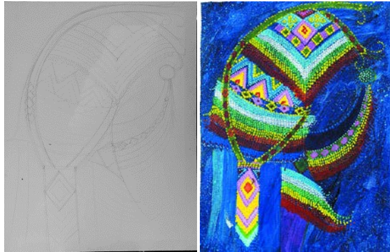
ภาพที่ 6 ภาพร่างต้นแบบด้วยลายเส้นและสี ผลงานสร้างสรรค์ ชั้นที่ 2

2) ขยายภาพร่างลงบนเฟรมผ้าใบตามขนาดที่กำหนดลงสีโดยรวม และสร้างค่าน้ำหนักอ่อนแก่ ความแตกต่างของสีแต่ละลวดลายและรูปทรง รวมถึงกำหนดสีพื้นหลัง ซึ่งสีภายในภาพประกอบด้วยสีวรรณะเย็นที่ให้ความรู้สึกสงบ ความสดชื่น ความคิดฝัน ความเรียบร้อย ผสมผสานกับสีวรรณะร้อนที่ให้ความรู้สึกร้อนแรง กระตุ้นประสาทตาให้เกิดความกระปรี้กระเปร่าและอบอุ่น ประกอบเรียงเข้าด้วยกันในผลงานเพื่อให้สีสร้างค่าขัดกันไม่ให้น่าเบื่อหน่ายในผลงานสร้างสรรค์