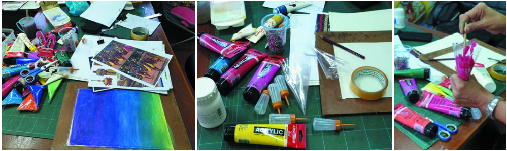
ภาพที่ 4 จัดเตรียมเครื่องมืออุปกรณ์ต่าง ๆ ในการสร้างสรรค์ผลงาน