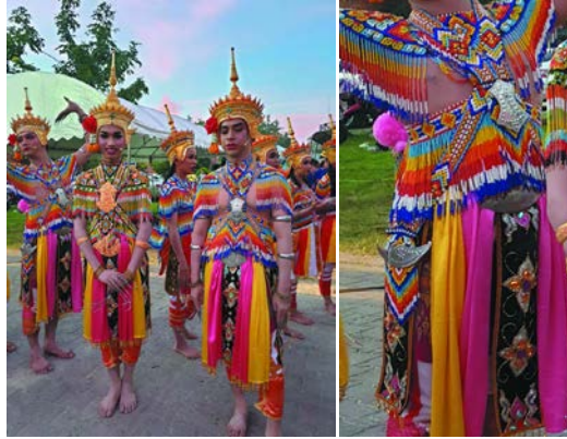
ภาพที่ 2 ลวดลายของเครื่องแต่งกายโนรา จังหวัดพัทลุง