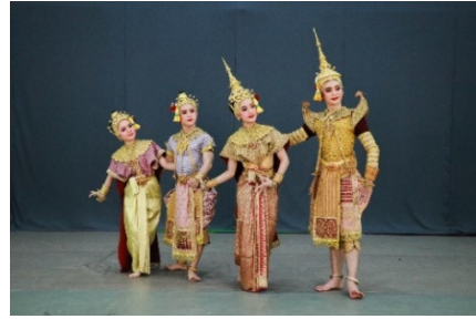
ภาพที่ 2 การแต่งกายประกอบการแสดง นาฏยประดิษฐ์ ชุด สীগซ์ตรียทรงเครื่อง

1.6 การสร้างสรรค์ฉากประกอบการแสดง ผู้สร้างสรรค์นำเทคนิคกรีนสกรีน (Green Screen) คือ การแยกนักแสดงออกจากพื้นหลังซึ่งมีสีเขียว หรือสีที่กำหนดเป็นฉากหลัง โดยภาพนักแสดงที่แยกออกมาแล้วนั้นถูกนำไปวางทับซ้อนบนภาพฉากหลังที่คอมพิวเตอร์สร้างขึ้น (อรุณวิทย์ สุดแสง และคณะ, 2560, น. 14) การใช้เทคนิคดังกล่าวเป็นการสร้างสรรค์ขึ้นเพื่อให้การแสดงรำทรงเครื่องเกิดมิติใหม่ที่ต่างไปจากเดิม