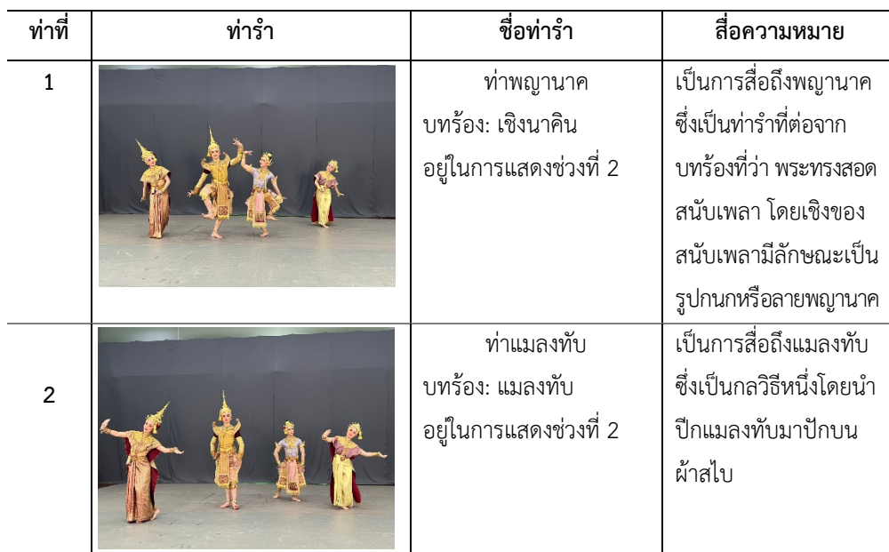
ตารางที่ 3 : ทำรำตามหลักการจินตนาการในการแสดงนาฏยประดิษฐ์ ชุด สীগซ์ตรีย์ทรงเครื่อง

1.4.3 ใช้หลักการตามจินตนาการ คือ ทำรำที่สร้างสรรค์ขึ้นตามแนวคิดและจินตนาการของผู้สร้างสรรค์ โดยสื่อความหมายถึงคน สัตว์ สิ่งของ ที่ปรากฏในบทประพันธ์