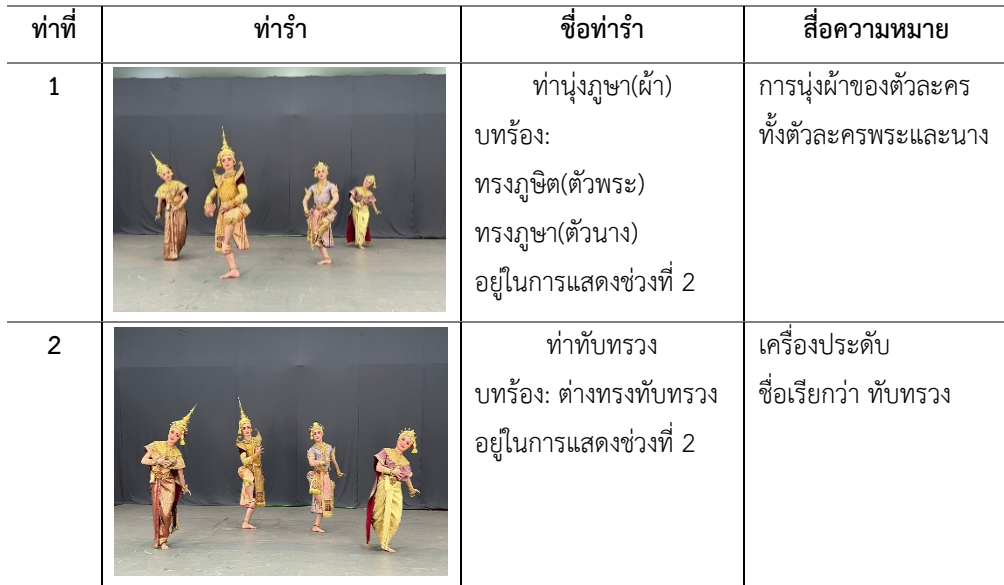
ตารางที่ 1 : ทำรำตามแบบแผนรำทรงเครื่องในการแสดงนาฏยประดิษฐ์ ชุด สีกษัตริย์ทรงเครื่อง