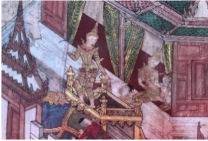
ภาพที่ 1 ภาพจิตรกรรมฝาผนังพระเวสสันดร ชาดกพระอุโบสถ วัดสุวรรณารามราชวรวิหาร ที่มา : ผู้สร้างสรรค์