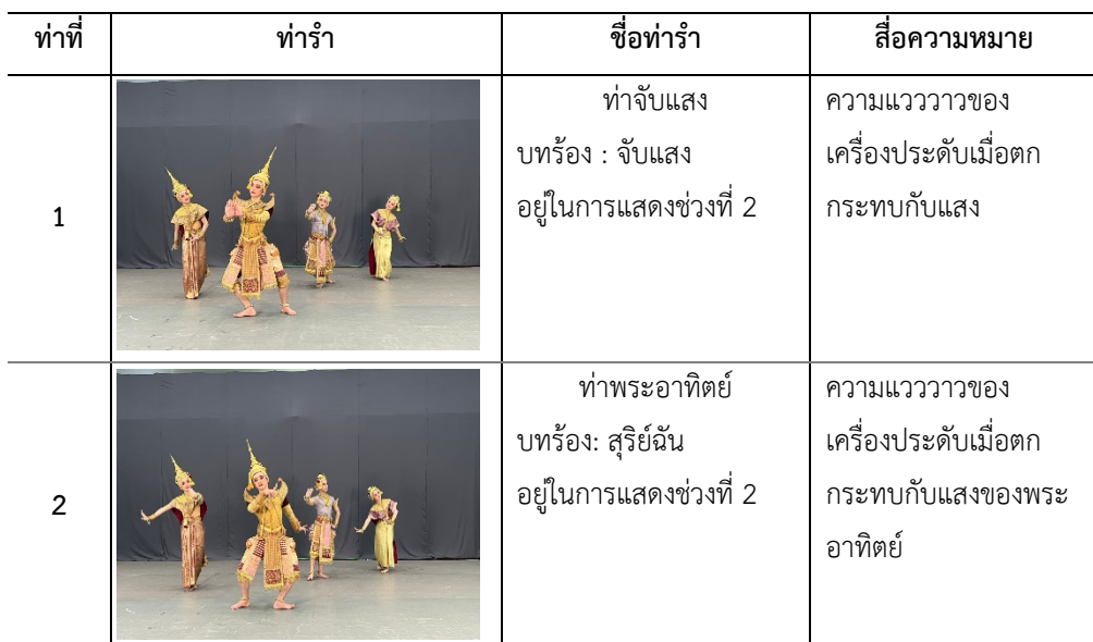
ตารางที่ 2 : ทำรำตามหลักการตีบทผสมผสานท่าทางธรรมชาติ นาฏยประดิษฐ์ ชุด สีกษัตริย์ทรงเครื่อง

1.4.2 ใช้หลักการตีบทผสมผสานท่าทางธรรมชาติ (ท่ารำสื่อความหมาย) คือ ท่ารำที่สื่อสารความหมายตามกิริยาท่าทางตามธรรมชาติ หรือสามารถเรียกได้ว่า ภาษาท่า นาฏศิลป์