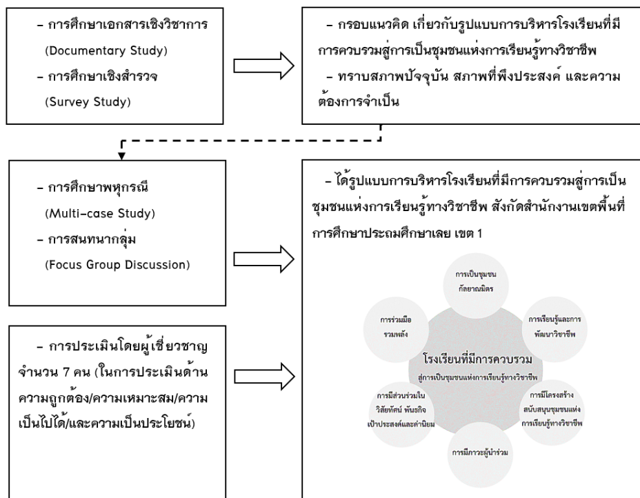
แผนภาพที่ 2 องค์ความรู้ที่ได้จากการศึกษารูปแบบการบริหารโรงเรียนที่มีการควมรวมผู้การเป็นชุมชนแห่งการเรียนรู้ทางวิชาชีพ สังกัดสำนักงานเขตพื้นที่การศึกษาประถมศึกษาเลย เขต 1

จากการวิจัยครั้งนี้ทำให้ทราบสภาพปัจจุบัน สภาพที่พึงประสงค์ และความต้องการจำเป็นในการพัฒนาเพื่อนำมาทำการศึกษาพหุกรณีจากบุคลากรในโรงเรียนที่มีการควมรวม และนำข้อมูลที่ได้มาสนทนากลุ่มโดยผู้มีส่วนได้ส่วนเสีย จนนำมาสู่การสร้างรูปแบบการบริหารที่มีการควมรวมผู้การเป็นชุมชนแห่งการเรียนรู้ทางวิชาชีพ สังกัดสำนักงานเขตพื้นที่การศึกษาประถมศึกษาเลย เขต 1 ซึ่งผลการวิจัยที่ได้ในครั้งนี้จะเป็นองค์ความรู้ให้กับผู้บริหารสถานศึกษา และผู้ที่เกี่ยวข้องให้สามารถนำผลการวิจัยไปใช้เป็นแนวปฏิบัติในการพัฒนา และการยกระดับคุณภาพของโรงเรียนที่มีการควมรวมให้มีประสิทธิภาพต่อไป ดังแผนภาพที่ 2