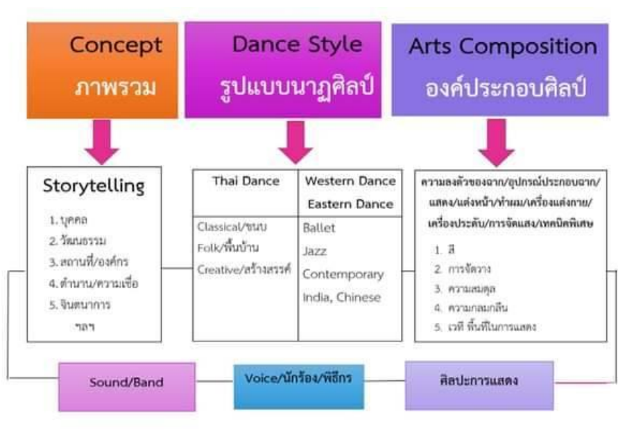
แผนภูมิที่ 2 การออกแบบการแสดงในการแสดงการประกวดวงดนตรีลูกทุ่งไทย (ผู้วิจัย, 2568)

ความรู้ที่ได้จากคณะกรรมการรายการชิงช้าสวรรค์ ได้เกิดองค์ความรู้ใหม่ที่สามารถอธิบายผ่านโมเดลการออกแบบการแสดง ซึ่งประกอบด้วย 3 องค์ประกอบหลัก ได้แก่ 1) ภาพรวม (Concept), 2) รูปแบบนาฏศิลป์ (Dance Style), และ 3) องค์ประกอบศิลป์ (Arts Composition) โดยทั้งสามส่วนมีความสัมพันธ์กันอย่างเป็นระบบและส่งผลต่อกันในเชิงปฏิบัติ