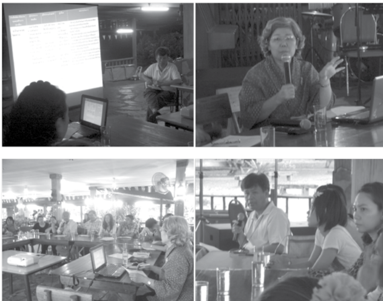
ภาพที่ 2 การสนทนากลุ่มเป้าหมายของกลุ่มผู้ประกอบการท่องเที่ยว ณ ห้องประชุม โรงแรมเขาใหญ่ควาบอยชิตีรีสอร์ท อ.ปากช่อง จ.นครราชสีมา

1. การค้นหาแนวทางและสร้างแผนพัฒนาศักยภาพทุนมนุษย์ด้านการท่องเที่ยวเพื่อเสริมสร้างความเข้มแข็งในการจัดการท่องเที่ยวในภาคตะวันออกเฉียงเหนือตอนกลางโดยการสนทนากลุ่มเป้าหมายของกลุ่มผู้ประกอบการท่องเที่ยว จำนวน 20 คน โดยการนำเสนอข้อมูลที่ได้ทั้งหมดแล้วระดมความคิดเห็นวิเคราะห์สถานการณ์ปัญหาโดยใช้ห่วงโซ่อุปทาน (Supply Chain) โดยวิเคราะห์จากข้อมูลของกลุ่มผู้ประกอบการท่องเที่ยว กลุ่มผู้ให้บริการ/เจ้าหน้าที่ และกลุ่มผู้บริโภค/ผู้รับบริการ ตามประเด็นพัฒนาศักยภาพทุนมนุษย์ด้านการท่องเที่ยว 4 ประเด็น ได้แก่ 1) ด้านการบริหารจัดการ 2) ด้านเทคโนโลยีสารสนเทศ 3) ด้านการให้บริการ และ 4) ด้านภาษาและวัฒนธรรมได้ แผนงาน/โครงการ ดังภาพที่ 2