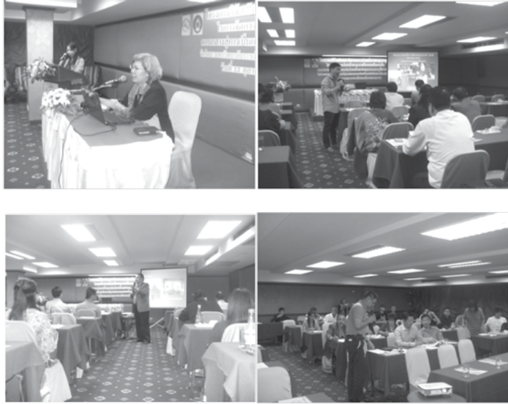
ภาพที่ 3 การประชุมเชิงปฏิบัติการแบบมีส่วนร่วมของกลุ่มผู้ประกอบการ ท่องเที่ยว ณ ห้องประชุมมรกต โรงแรมโฆษะ จ.ขอนแก่น