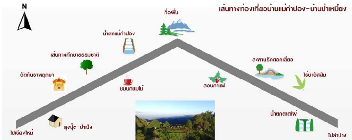
ภาพที่ 1 แผนที่เส้นทางการท่องเที่ยวเชิงนิเวศเชื่อมโยงจากหมู่บ้านแม่กำปองจังหวัดเชียงใหม่ไปหมู่บ้านป่าเหมี้ยงจังหวัดลำปาง

นอกจากนี้ นักท่องเที่ยวสามารถเดินทางจากหมู่บ้านป่าเหมี้ยงโดยใช้ทางหลวงหมายเลข 1252 เพื่อเยี่ยมชมอุทยานแห่งชาติแจ้ซ้อน น้ำตกแจ้ซ้อน น้ำพุร้อนแจ้ซ้อน และวัดเฉลิมพระเกียรติได้อีกด้วย ดังภาพที่ 1