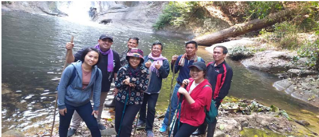
ภาพที่ 3 การเดินสำรวจแหล่งท่องเที่ยวสร้างสรรค์เชิงนิเวศในชุมชนโดยคณะนักวิจัย ผู้ประกอบการท่องเที่ยว ผู้นำชุมชนและผู้มีส่วนได้เสีย