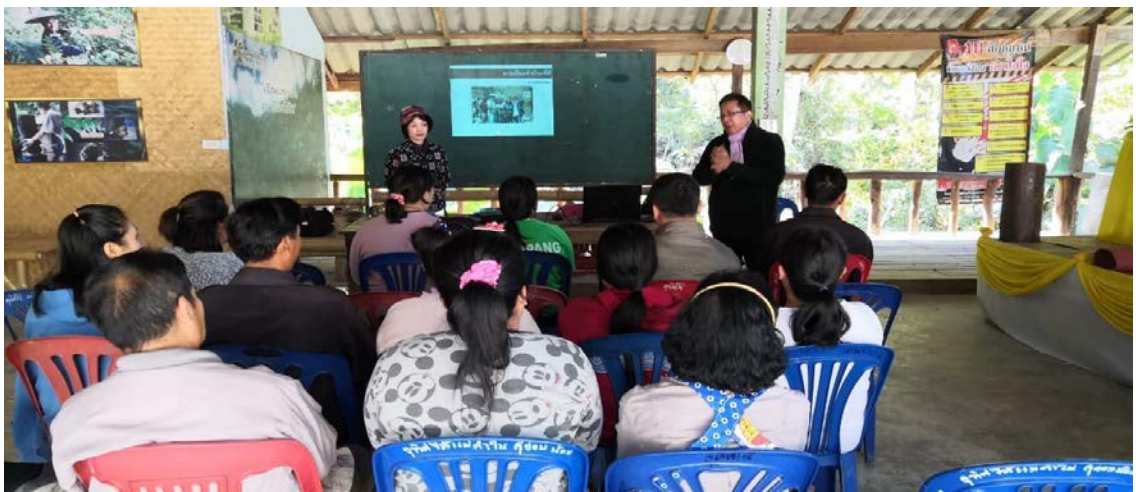
ภาพที่ 2 การวิเคราะห์ศักยภาพชุมชนและเสวนากลุ่มย่อยกับกลุ่มผู้มีส่วนได้เสีย