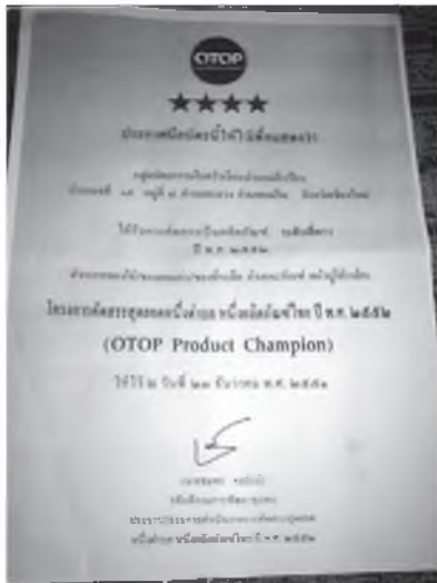
ภาพที่ 1 แสดงใบประกาศนียบัตร OTOP ระดับ 4 ดาว

ผลิตภัณฑ์ที่จัดจำหน่าย แบ่งเป็นหมวดหมู่ดังนี้ ผ้าพันคอ กระเป๋า เสื้อผู้หญิง ผ้าถุง ผ้าคลุมเตียง ผ้าปูโต๊ะเล็ก