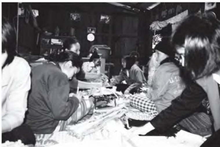
ภาพที่ 3 แสดงกิจกรรมการเตรียมผลิตภัณฑ์ผ้าทอกะเหรี่ยงไปจำหน่าย