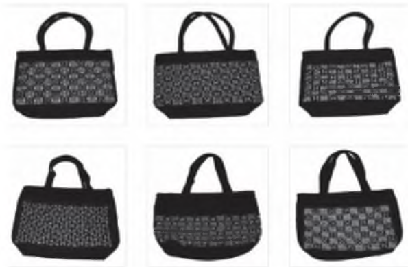
ภาพที่ 2 ตัวอย่างผลิตภัณฑ์ผ้าทอกะเหรี่ยง