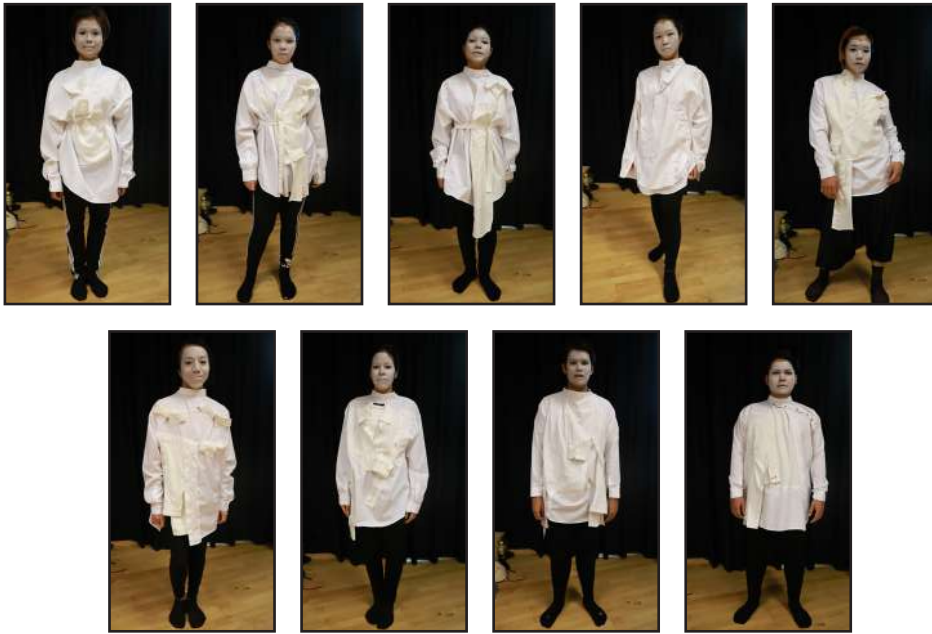
ภาพที่ 7 เครื่องแต่งกายและการแต่งหน้าของนักแสดง 19 คน

5. อุปกรณ์ประกอบการแสดงผู้วิจัยได้ออกแบบอุปกรณ์ประกอบการแสดงที่สอดคล้องกับเรื่องราวที่ดำเนินในแต่ละฉาก ส่วนใหญ่จะเลือกใช้อุปกรณ์ประกอบการแสดงที่เป็นสิ่งที่พบเห็นได้ง่ายในชีวิตประจำวัน โดยสามารถแบ่งประเภทของการใช้อุปกรณ์ประกอบการแสดงออกเป็น 3 ลักษณะ คือ 1. อุปกรณ์ประกอบการแสดงในลักษณะประกอบฉาก (Set props) ได้แก่ เก้าอี้ 2. อุปกรณ์ประกอบการแสดงในลักษณะประกอบการแต่งกาย (Costume props) ได้แก่ หน้ากากอนามัย เสื้อกันฝน แว่นตาดำ 3. อุปกรณ์ประกอบการแสดงในลักษณะที่นักแสดงใช้ถือหรือหยิบจับ (Hand props) ได้แก่ หนังสือนิโครโฟน รมไล่ ไฟฉาย ตะกร้า รถเข็นซูเปอร์มาเก็ต พานขาว ผงสี กระจาด A4 สีขาว