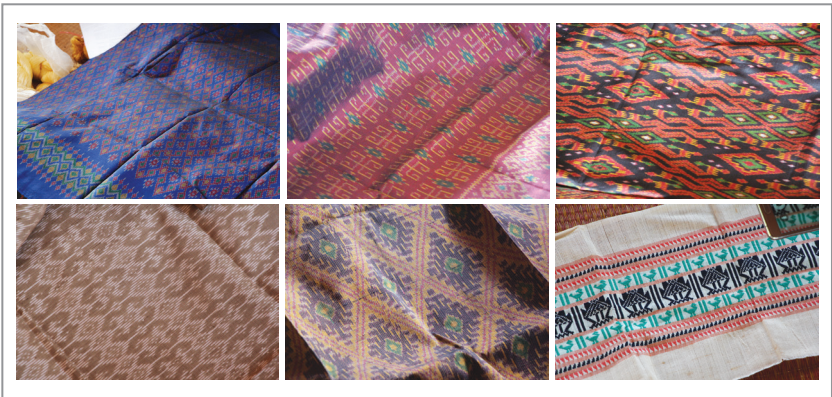
ภาพที่ 1 ลวดลายผ้าหมัดหมี่ดั้งเดิม

ลวดลายในตำนานพื้นบ้าน เช่น ลวดลายนาค ลายขอ ลายโคม ลายต้นสน ส่วนใหญ่ การวางลวดลายจะกระจายไปตลอดทั้งผืน โดยนิยมมีตีนขึ้นเสมอ กลุ่มผู้ทอผ้าใช้ ก็ทอผ้าและอุปกรณ์ทอผ้าใหม่แบบพื้นบ้าน (ก็ทอมือแบบกระทบ) และลวดลายที่ทอ ยังเป็นลวดลายที่บรรพบุรุษสวมใส่ในงานประเพณีต่างๆ นอกจากลวดลายที่มีมา แต่เดิมยังมีกลุ่มพ่อค้าที่ขายลวดลายที่ออกแบบผ่านตารางกราฟ ในหมู่บ้านใกล้เคียง โดยจำหน่ายในราคาขายละ 20 บาทต่อแผ่น จากจุดเด่นในการปลูกหม่อนเลี้ยงไหม สาวเส้นไหมพันธุ์ไทยพื้นบ้านภายในกลุ่มเครือข่ายแล้ว ทางกลุ่มยังเป็นกลุ่มผู้ประกอบการ อาชีพตามพระราชดำริของสมเด็จพระเทพรัตนราชสุดาฯ สยามบรมราชกุมารี มี สมาชิกกลุ่มรวม 47 คน ผลิตผ้าไหมส่งให้กับร้านภูฟ้า ตามการสั่งซื้อของร้านภูฟ้า สี ขนาด ลวดลาย ตามที่ร้านต้องการ จุดเด่นของกลุ่มคือมีการปลูกหม่อนเลี้ยงไหม พื้นบ้าน มีการสาวไหมเอง นอกจากอาชีพการปลูกหม่อนเลี้ยงไหมแล้ว ทางหมู่บ้าน ยังมีการใช้พื้นที่ปลูกผักสวนครัวแบบปลอดสารพิษ และเป็นแปลงผสมผสานปลูกผัก รวมกัน เช่น มะเขือเทศ ข้าวโพด ฟักทอง ผักกาด กะหล่ำปลี เป็นต้น โดยมีการแบ่ง พื้นที่ให้แก่คนในชุมชน โดยแบ่งให้ครอบครัวละ 2-3 แปลง เป็นแปลงปลูกพืชผัก ปลอดสารพิษ เพื่อกินกันในครัวเรือน เมื่อเหลือจึงนำไปขาย เมื่อหน้าแล้งมาถึงราคา พืชผักจึงสูงทำให้ไม่สามารถซื้อหาพืชผักมารับประทานได้