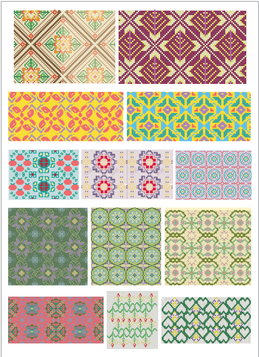
ภาพที่ 4 ผลงานการออกแบบลวดลายของผู้เข้าร่วมโครงการ