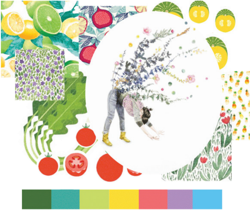
ภาพที่ 3 รูปภาพแรงบันดาลใจ และภาพรวมของสี และลวดลาย