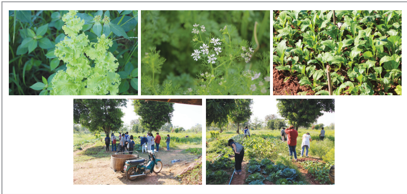
ภาพที่ 2 รูปภาพแปลงปลูกผัก