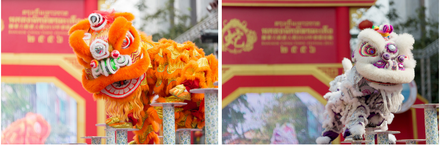
ภาพที่ 1 สิงโตกวางตุ้งแบบฝ่อซาน (ภาพซ้าย) และ สิงโตกวางตุ้งแบบเหอซาน (ภาพขวา)

นิยมเชิดในมณฑลกวางตุ้ง กวางซี และฮกเกี้ยน แต่ต่อมาภายหลังชาวจีนทางตอนใต้และในมณฑลกวางตุ้งได้อพยพไปอยู่ยังภูมิภาคต่าง ๆ ของโลก สิงโตกวางตุ้งจึงเป็นศิลปะการแสดงที่เล่นกันอย่างแพร่หลาย แม้แต่ในประเทศไทยก็ได้รับรูปแบบการเชิดสิงโตแบบกวางตุ้ง ดังที่เราเห็นอยู่ในปัจจุบัน (ดลธรรม เปี่ยมทองคำ, สัมภาษณ์, มีนาคม 9, 2565)