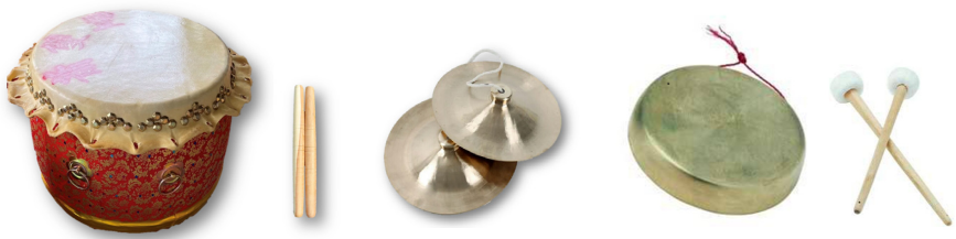
ภาพที่ 5 กลองสิงโต (ภาพซ้าย) แฉ (ภาพกลาง) และ เม็ง (ภาพขวา)

เม็ง เป็นเครื่องดนตรีที่หล่อด้วยโลหะหนา มีลักษณะคล้ายฆ้องโหม่งของไทย แต่ ไม่มี ปุ่มนูนตรงกลาง มีฐานแผ่ออกไปโดยรอบหักงุ้มออกไปเป็นขอบ และที่ขอบจะมีการเจาะรู 2 รู ไว้ร้อยเส้นเชือกสำหรับห้อย ทำให้เกิดเสียงโดยการตีด้วยไม้ โดยสาเหตุที่เรียกว่า เม็ง อาจมา จากเสียงที่กระทบกันขณะตี จะได้ยินเสียงเป็น “เป็ง – เป็ง” หรือ “เม็ง – เม็ง” ด้วยลักษณะ ที่ไม่มีปุ่มนูนตรงกลางจึงทำให้มีเสียงที่แหลมสูง (ธนิธ อยุธยา, 2523, น. 18-29)