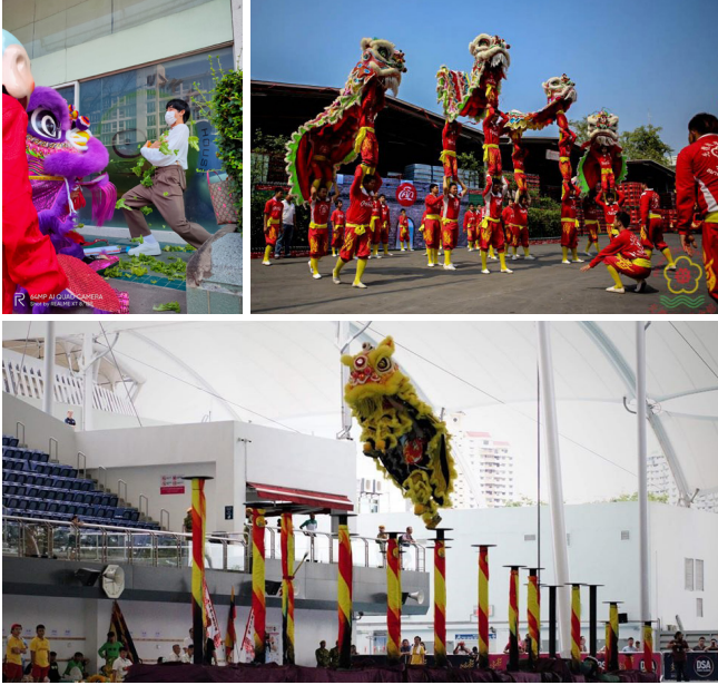
ภาพที่ 2 เชิดสิงโตพื้น (ภาพซ้าย) เชิดสิงโตต่อตัว (ภาพกลาง) เชิดสิงโตบนเสาต่างระดับ (ภาพขวา)