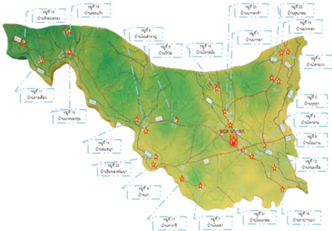
ภาพประกอบที่ 1 แผนที่พื้นที่ตำบลนาออก.

ตำบลนาออกเป็นตำบลหนึ่งของอำเภอศรีบุญเรือง จังหวัดหนองบัวลำภู ทิศเหนือติดต่อกับตำบลโนนสะอาด จังหวัดหนองบัวลำภู ทิศตะวันออกติดต่อกับตำบลศรีบุญเรือง จังหวัดหนองบัวลำภู ทิศใต้ติดต่อกับอำเภอหนองนาคำและอำเภอสีชมภู จังหวัดขอนแก่น ทิศตะวันตกติดต่อกับอำเภอภูกระดึง จังหวัดเลย