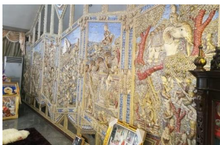
ภาพที่ 1 ผลงานศิลปกรรมเรื่องพระมหาชนที่ร้านแม่กิมไล้

ผลงานปูนปั้นประดับกระถ้ายกระเบื้องเรื่องพระมหาชนที่ร้านแม่กิมไล้ เป็นผลงานของช่างทองรุ่ง เอ็มโอบุส สร้างสรรค์ขึ้นเมื่อปี พ.ศ.2543 นำเสนอเรื่องพระมหาชน มีลักษณะจัดวางภาพกรอบรวม 6 กรอบ มีเหตุการณ์ที่นำเสนอจำนวน 17 เหตุการณ์ ดังต่อไปนี้