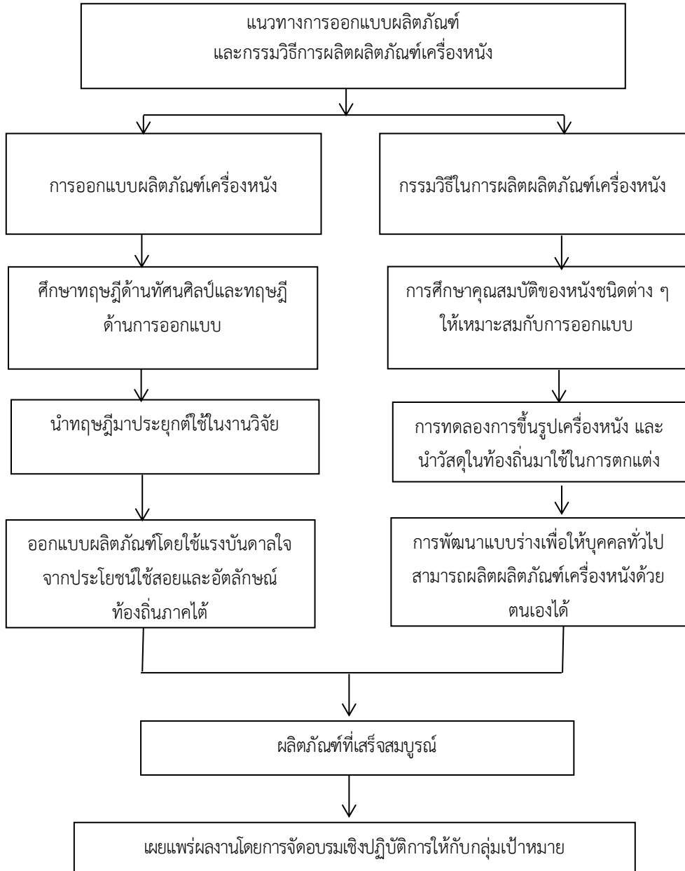
ภาพที่ 6 กรอบแนวคิดในการวิจัย

สำหรับแนวทางในการออกแบบและกรรมวิธีในโครงการวิจัยเรื่อง หัตถกรรมงานหนังสร้างสรรค์: กรณีศึกษาการทำผลิตภัณฑ์เครื่องหนังจากเศษหนังที่เหลือใช้จากอุตสาหกรรมเครื่องหนัง ผู้วิจัยได้ออกแบบแผนภาพเพื่อเป็นแนวทางในการออกแบบและกรรมวิธีการผลิต ดังนี้