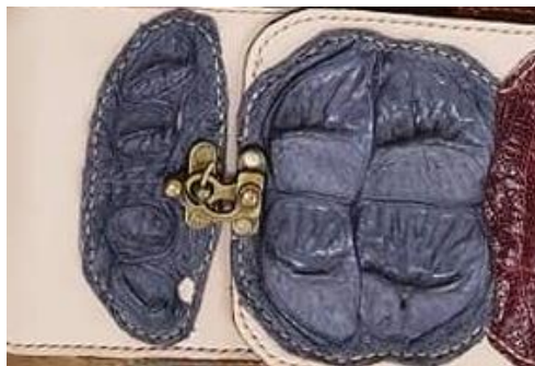
ภาพที่ 3 การจัดวางสี ชนิดของหนังที่แตกต่างและเย็บติดให้เกิดความสวยงามของผลิตภัณฑ์ในงานวิจัย