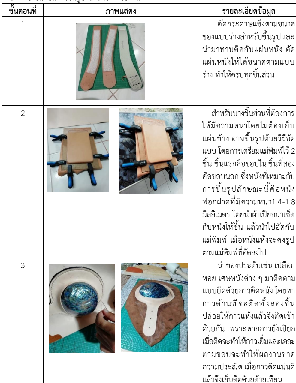
ตารางที่ 3 ขั้นตอนการขึ้นรูปผลิตภัณฑ์เครื่องหนัง

เมื่อได้แบบร่างแนวคิดและแบบร่างสำหรับขึ้นรูปแล้ว ผู้วิจัยจึงทดลองการขึ้นรูปผลิตภัณฑ์ ซึ่งในโครงการวิจัยนี้เลือกการขึ้นรูปผลิตภัณฑ์เครื่องหนังด้วยมือ เนื่องจากไม่ต้องใช้อุปกรณ์มากนัก และบุคคลทั่วไปก็สามารถที่จะทำได้ ซึ่งการเย็บขึ้นรูปผลิตภัณฑ์ในโครงการวิจัย มีขั้นตอนที่สามารถแสดงเป็นตารางได้ ดังนี้