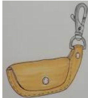
ภาพที่ 5 การนำรูปทรงเรือหัวโทงมาตัดตอนและออกแบบสร้างสรรค์เป็นผลิตภัณฑ์พวงกุญแจของที่ระลึก