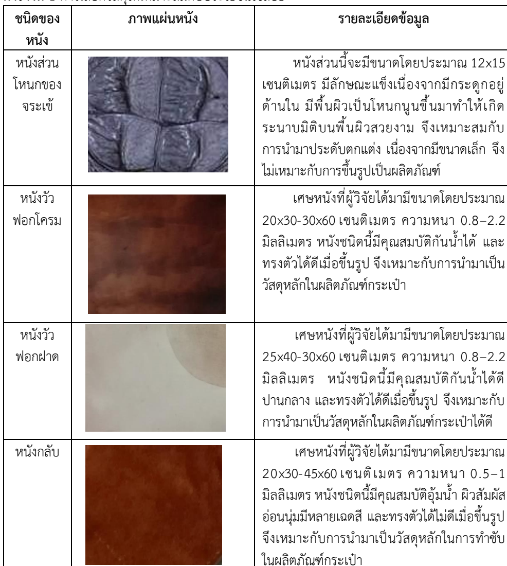
ตารางที่ 1 การเลือกวัสดุให้เหมาะสมกับประโยชน์ใช้สอย

วัสดุหลักในงานวิจัยคือเศษหนังเหลือใช้ในอุตสาหกรรมเครื่องหนัง ซึ่งผู้วิจัยไม่สามารถที่จะกำหนดคุณภาพ ขนาด ความหนาและสีของหนังได้ เนื่องจากว่าในแต่ละสถานประกอบการจะใช้หนังที่ไม่เหมือนกัน เช่น บางที่ใช้หนังวัวฟอกฝาด บางที่ใช้หนังจระเข้ บางที่ใช้หนังปลากะเบน เป็นต้น นอกจากนี้ในการผลิตแต่ละครั้งก็ยังใช้หนังที่มีเฉดสีและความหนาต่างกันอีกด้วย ด้วยเหตุนี้ผู้วิจัยจึงได้หนังหลากหลายประเภท ซึ่งหนังแต่ละชนิดก็มีคุณสมบัติที่เหมาะสมกับประโยชน์ใช้สอยที่แตกต่างกันไป ซึ่งอธิบายรายละเอียดเป็นตารางได้ดังนี้