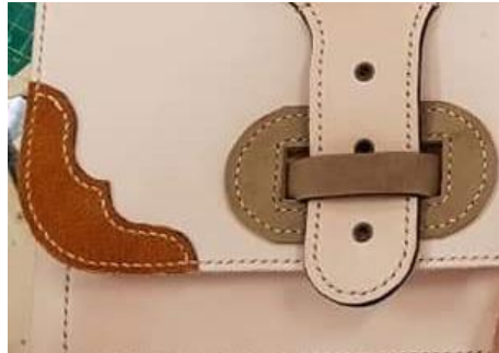
ภาพที่ 2 การจัดวางสี ชนิดของหนังที่แตกต่างและเย็บติดให้เกิดความสวยงามของผลิตภัณฑ์ในงานวิจัย ที่มา: พีรพงษ์ พันธะศรี, 2561