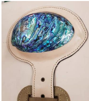
ภาพที่ 1 ภาพร่างและตัวอย่างการติดเปลือกหอยในงานวิจัย