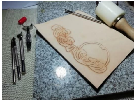
ภาพที่ 4 การจัดวางลวดลาย โดยใช้รูปทรงของเรือหัวโทง ผสมผสานกับรูปทรงของคลื่นทะเล โดยใช้เทคนิคการตอกหนัง ที่มา: พีรพงษ์ พันธะศรี, 2561