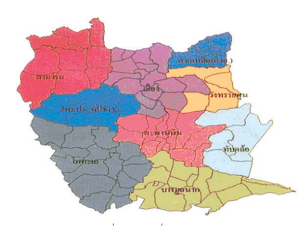
รูปภาพที่ 1: แผนที่อำเภอตะพานหิน

สินค้าที่เป็นที่ต้องการของตลาดสินค้าในอำเภอตะพานหิน จาก คำบอกเล่าของนายเช้า อ่ำรักษ์ (2558. สัมภาษณ์) ว่าเมื่อก่อนในพื้นที่ ตะพานหินนั้น มีสินค้าที่สำคัญทางการเกษตรที่ใช้ในการค้าขาย จำพวก ข้าวโพด ถั่ว อ้อย ข้าวและของป่า ที่คนในพื้นที่จะนำออกมาขายที่ตลาด ตะพานหิน และด้วยการเจริญเติบโตของพืชไร่ต่าง ๆ ทำให้คนในพื้นที่หันมา ทำเป็นธุรกิจระดับชุมชน ที่ทำกันในเฉพาะกลุ่มชุมชนหรือหมู่บ้าน เช่น โรงหีบอ้อย ที่คั้นน้ำอ้อยเพื่อส่งไปโรงงานน้ำตาลที่จังหวัดกำแพงเพชรและ จังหวัดพิษณุโลก ในพื้นที่ตะพานหินมีงานปลูกอ้อยรองจากการปลูกข้าว โดยอ้อยที่คนในตะพานหินนิยมปลูกมี 2 ชนิดคือ อ้อยเคี้ยว คืออ้อยที่มีเปลือก และชานนิ่ม มีความหวานในระดับปานกลางถึงระดับสูง ปลูกเพื่อนำน้ำอ้อย ไปบริโภคโดยตรง หรือใช้สำหรับรับประทานสด และอ้อยอีกชนิดคืออ้อยผลิต ้ ข้ำตาลบอกจากส่งพื้บที่ดังที่กล่าวบาแล้วยังบีการบำไปทำบ้ำตาลปึกด้วย