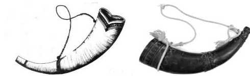
ภาพที่ 2 (ซ้าย) แสลงชัย (โศงฆฉัฒ) หรือพิสนธูชัย (ขวา) แสลงทัฬ (โศงฆฉัฒ)

พิสนธูชัยเป็นปีเขาสัตว์ ทำจากเขาคาวที่มีความยาวโค้งงอสวยงาม ตรงปากจะทำเป็นรูปหางปลา มีรูปทรงประณีตกว่าเส่งงทัฬ ด้านปลายแหลมตัดสำหรับเป็นที่เป่า สันนิษฐานว่าในอดีตน่าจะเป็นการเป่าแบบไม่ใช่ลิ้น (non reed) ซึ่งต้องอาศัยผู้เป่าที่ชำนาญ ต่อมาอาจจะเพิ่มลิ้นเข้าไปเพื่อให้เป่าได้ง่ายขึ้น พิสนธูชัย หรือ แสลงชัย (โศงฆฉัฒ) หรือเส่งงชัยจะมีหวง 2 อันสำหรับใช้ผูกเชือกสะพาย เชือกนี้จะเคลือบผิวด้วยขี้ผึ้งเพื่อให้ผิวเรียบและเหนียว เชือกดังกล่าวจะต้องลงคาถาอาคมเพื่อให้เกิดสิริมงคล มีชัยชนะเหนือข้าศึกศัตรูและขจัดปัดเป่าเสนียดจัญไรทั้งปวง