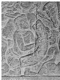
ภาพที่ 3 พาทย์ฆ้อง หรือ พาทย์คอง (๓๑๖๓) ภาพจำหลักที่ปราสาทนครวัด คริสต์ศตวรรษที่ 16

พาทย์ในสมัยสุโขทัยหมายถึงฆ้องชุด ฆ้องราง ที่มีจำนวนลูกฆ้องเพียง 8 ลูกเท่านั้น เพราะเพียงพอต่อการบรรเลงทำนองในยุคนั้นแล้ว ลักษณะรูปร่างของพาทย์ฆ้องปรากฏในภาพจำหลักที่ปราสาทนครวัด ระเบียงทิศเหนือ คริสต์ศตวรรษที่ 16 ปัจจุบันชาวกัมพูชายังใช้พาทย์ฆ้องบรรเลงในวงไตรลักษณ์ (វង់ត្រៃល័ក្ខណ៍) หรือวงตร่วมมิ่ง (វង់ត្រៃម័ង) ประกอบพิธีศพในจังหวัดเสียมเรียบ ราชอาณาจักรกัมพูชา เช่นเดียวกับชาวบ้านปอยตระแบง ตำบลนาบัว อำเภอเมือง จังหวัดสุรินทร์ ที่ยังคงใช้พาทย์ฆ้องที่มีจำนวนลูกฆ้อง 8 ลูกเช่นกัน ส่วนในสมัยกรุงศรีอยุธยาจนถึงสมัยกรุงธนบุรียังคงใช้พาทย์ฆ้องในลักษณะเช่นนี้อยู่บ้างและมีการปรับเปลี่ยนลักษณะรูปร่างของวงฆ้องให้เป็นแนวระนาบตรง จนเรียกชื่อว่า “ฆ้องราง” ต่อมาได้มีการเพิ่มจำนวนลูกฆ้องเพิ่มมากขึ้นเพื่อประโยชน์ในทางบรรเลงทำนองเพลง รูปร่างของวงฆ้องจึงปรับเปลี่ยนเป็นดังเช่นปัจจุบัน จึงได้เรียก “พาทย์ฆ้อง” ว่า “ฆ้องวง” ตามรูปร่างของวงฆ้อง