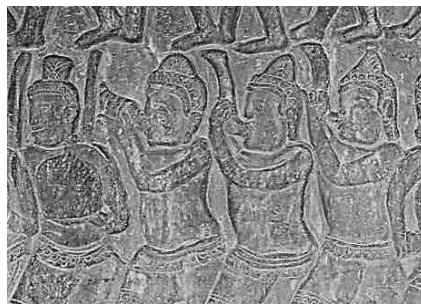
ภาพที่ 1 (ซ้าย) แตรกัมพู ภาพจำหลักที่ปราสาทนครวัด (ขวา) แตรศฤงคะ