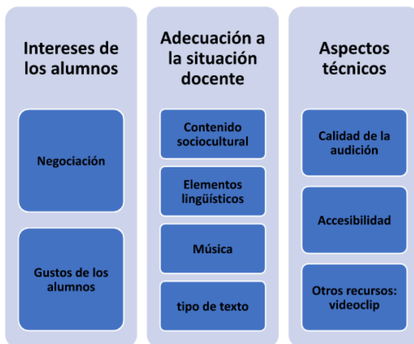
Gráfico 3: Criterios de selección de las canciones

Sin olvidar que, como señala Rodríguez López (2005, p. 808), hay canciones que a pesar de la gran difusión y entusiasmo que despiertan en los estudiantes, pueden resultar muy pobres en el plano lingüístico e incluso incomprensibles, por lo que no sería aprovechable con fines didácticos. Lo mismo podríamos decir del plano cultural.