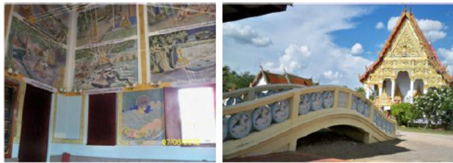
ภาพที่ 7 วัดเทพประสิทธิ์ ซ้าย คือ จิตรกรรมฝาผนังโบสถ์ ขวา คือ สะพานที่เคยใช้ข้ามคูคลองเข้ามายังอุ้งเรือภายในวัด