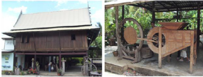
ภาพที่ 5 บ้านคุณทวีป เจือไทย ซ้าย คือ เรือนไทยที่ใช้อาศัย ขวา คือ บริเวณโรงทำน้ำตาลถูกใช้เก็บเครื่องมือเกษตร