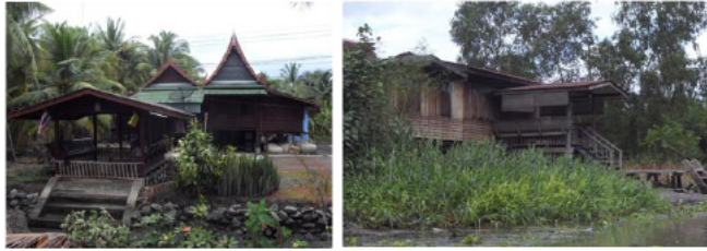
ภาพที่ 9 การตั้งบ้านเรือนในท่าคา