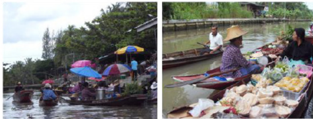
ภาพที่ 3 ตลาดน้ำท่าคา ขายพืชผลและผลิตภัณฑ์แปรรูปทางการเกษตร