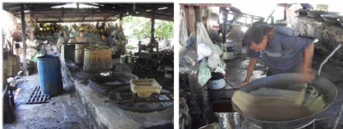
ภาพที่ 4 เตาตาลบ้านคุณสำเภา ซ้าย คือ เตาเคี้ยวตาล (เตาชาวบ้าน) ขวา คือ การบรรจุน้ำตาลมะพร้าวเพื่อแบ่งขาย