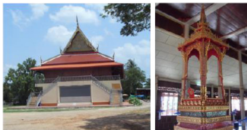
ภาพที่ 8 วัดมณีสรรค์คณาวาส ซ้าย คือ ศาลาการเปรียญ ขวา คือ ธรรมาสน์