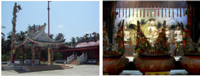
ภาพที่ 6 ศาลเจ้าแม่ตัวเนี้ย ซ้าย คือ บรรยากาศภายนอกและตัวอาคารศาลเจ้า ขวา คือ รูปไม้แกะสลักแม่ตัวเนี้ย