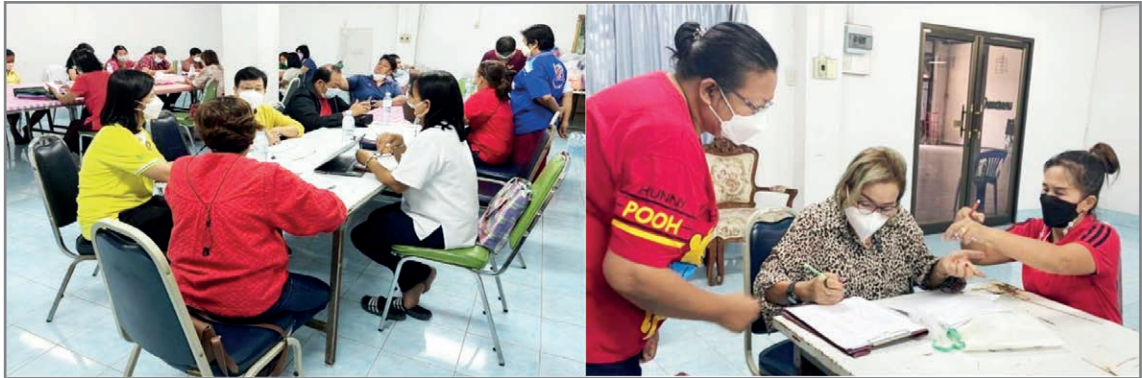
ภาพ 2 การอบรมเชิงปฏิบัติการ หัวข้อ “ถ่ายทอดนวัตกรรมการเงินการบัญชีขององค์กรชุมชนบ้านมั่นคง”

การรายงานทางการเงิน ทั้งนี้เพื่อให้ผู้เข้ารับการอบรมได้รับความรู้ เข้าใจและเกิดทักษะในการจัดบัญชีมากขึ้น