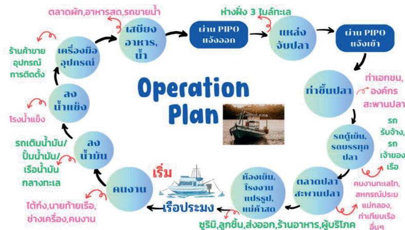
ภาพ 2 Operation Plan

กระบวนการทำธุรกิจประมงนั้นค่อนข้างมีความซับซ้อน ดังจะเห็นได้จากภาพ 1 กระบวนการทำธุรกิจประมง ที่พบว่า เริ่มต้นจากการหาแหล่งเงินทุน เช่น ธนาคาร มีการเริ่มสร้างเรือที่อยู่ต่อเรือโดยใช้ช่างฝีมือเฉพาะทาง มีการซื้ออุปกรณ์จากโรงกลึง โรงหล่อโลหะ ไม้ ทองเหลือง เหล็ก เป็นต้น เจ้าของเรือประมงต้องไปติดต่อซื้อสินค้า เช่นเครื่องจักรต่างๆจากบริษัทนำเข้า ในการสร้างเรือหนึ่งลำจะต้องมีการติดตั้งอุปกรณ์ต่าง ๆ ที่สำคัญ เช่น เพลลา ใบจักร ทางเสือ เครื่องกว้าน อวน สลึง สมอ เรด้า ชวาวด์เตอร์ ระบบติดตามเรือ (VMS) เป็นต้น ซึ่งต้องซื้อมาจากร้านอุปกรณ์ฮาร์ดแวร์ของเรือ และซื้ออวนจากร้านที่ทำอวนโดยเฉพาะ จะเห็นได้ว่า กว่าชาวประมงจะสร้างเรือให้เสร็จสิ้นในแต่ละลำต้องใช้เงินทุน เสียดอกเบี้ยจากธนาคาร มีค่าใช้จ่ายในการจ้างงานกับช่างที่มีความชำนาญเฉพาะทาง รวมถึงบริษัทนำเข้าเครื่องจักร หรืออะไหล่ และอุปกรณ์ที่สำคัญต่าง ๆ มากมาย ซึ่งมีใช้เรื่องง่ายเลยในการประกอบธุรกิจเรือประมงเช่นนี้ ชาวประมงจะต้องมีความอดทน และมีความพยายามเป็นอย่างมาก ในการสร้างธุรกิจของพวกเขาเอง ชาวประมงบางรายก็เริ่มต้นจากการพายเรือจับปลาตกเบ็ดขาย พัฒนาตนเองมาเป็นประมงพื้นบ้านขนาดเล็ก เก็บหอมรอมริบด้วยความมานะ และยากลำบาก หรือกู้หนี้ยืมสินมาสร้างเรือประมงพาณิชย์ด้วยสองมือ และความสามารถของตนเอง