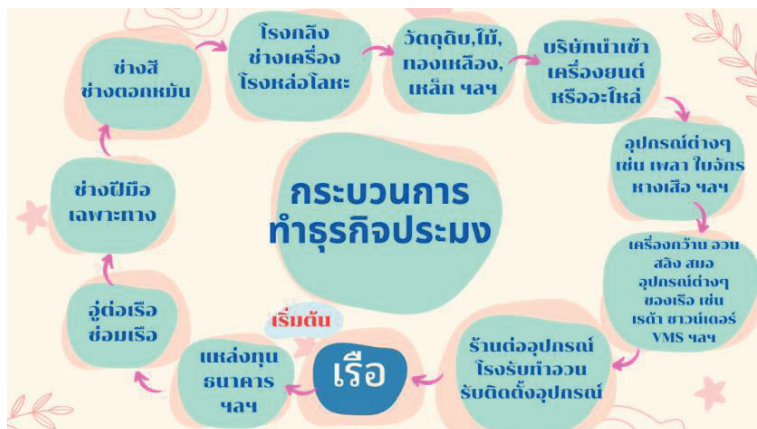
ภาพ 1 กระบวนการทำธุรกิจประมง

กระบวนการทำธุรกิจประมงนั้นค่อนข้างมีความซับซ้อน ดังจะเห็นได้จากภาพ 1 กระบวนการทำธุรกิจประมง ที่พบว่า เริ่มต้นจากการหาแหล่งเงินทุน เช่น ธนาคาร มีการเริ่มสร้างเรือที่อยู่ต่อเรือโดยใช้ช่างฝีมือเฉพาะทาง มีการซื้ออุปกรณ์จากโรงกลึง โรงหล่อโลหะ ไม้ ทองเหลือง เหล็ก เป็นต้น เจ้าของเรือประมงต้องไปติดต่อซื้อสินค้า เช่นเครื่องจักรต่างๆจากบริษัทนำเข้า ในการสร้างเรือหนึ่งลำจะต้องมีการติดตั้งอุปกรณ์ต่าง ๆ ที่สำคัญ เช่น เพลลา ใบจักร ทางเสือ เครื่องกว้าน อวน สลึง สมอ เรด้า ชวาวด์เตอร์ ระบบติดตามเรือ (VMS) เป็นต้น ซึ่งต้องซื้อมาจากร้านอุปกรณ์ฮาร์ดแวร์ของเรือ และซื้ออวนจากร้านที่ทำอวนโดยเฉพาะ จะเห็นได้ว่า กว่าชาวประมงจะสร้างเรือให้เสร็จสิ้นในแต่ละลำต้องใช้เงินทุน เสียดอกเบี้ยจากธนาคาร มีค่าใช้จ่ายในการจ้างงานกับช่างที่มีความชำนาญเฉพาะทาง รวมถึงบริษัทนำเข้าเครื่องจักร หรืออะไหล่ และอุปกรณ์ที่สำคัญต่าง ๆ มากมาย ซึ่งมีใช้เรื่องง่ายเลยในการประกอบธุรกิจเรือประมงเช่นนี้ ชาวประมงจะต้องมีความอดทน และมีความพยายามเป็นอย่างมาก ในการสร้างธุรกิจของพวกเขาเอง ชาวประมงบางรายก็เริ่มต้นจากการพายเรือจับปลาตกเบ็ดขาย พัฒนาตนเองมาเป็นประมงพื้นบ้านขนาดเล็ก เก็บหอมรอมริบด้วยความมานะ และยากลำบาก หรือกู้หนี้ยืมสินมาสร้างเรือประมงพาณิชย์ด้วยสองมือ และความสามารถของตนเอง