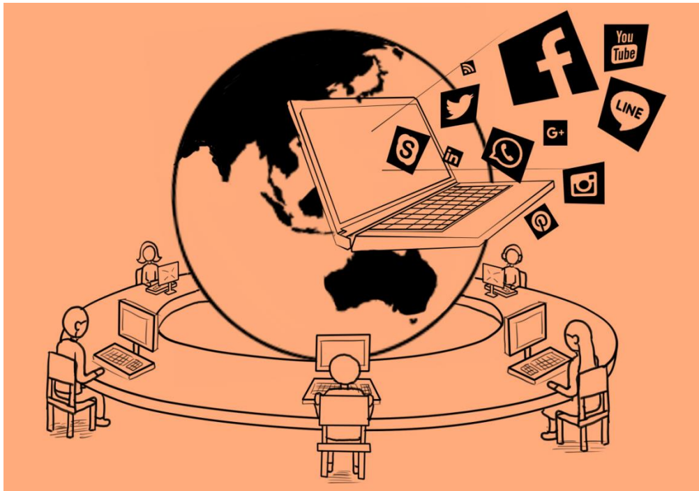
ภาพที่ ๑ ช่วงเวลาของศตวรรษที่ ๒๑

ดำเนินต่อไป ซึ่งเป็นยุคแห่งการเปลี่ยนแปลงทางด้านสังคม เศรษฐกิจ และวัฒนธรรม ฯลฯ อย่างรวดเร็ว อันสืบเนื่องมาจากความเจริญก้าวหน้าทางเทคโนโลยี ในขณะเดียวกันก็ส่งผลกระทบต่อวิถีการดำรงชีวิตของมนุษย์ในสังคมอย่างทั่วถึง ความเจริญทางวิทยาศาสตร์ทำให้สร้างนวัตกรรมทางเทคโนโลยีก้าวไปข้างหน้า ล้ำหน้าตลอดเวลา เปรียบดังได้ส่งสัญญาณให้มนุษย์ตระหนักถึงคลื่นแห่งการเปลี่ยนแปลงที่กำลังถาโถมเข้ามาอย่างรวดเร็ว แล้ววิถีชีวิตของมนุษย์จะเป็นเช่นไร นี่คือ เสน่ห์ที่น่าหลงใหลชักชวนให้นักศึกษาเรื่องเทคโนโลยีของศตวรรษที่ ๒๑ ต่อไป