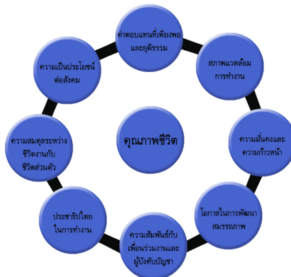
ภาพที่ 3 ความสัมพันธ์ระหว่างปัจจัยการทำงานทั้ง 8 ด้านกับคุณภาพชีวิต

การพัฒนาคุณภาพชีวิตให้ดีขึ้นนั้นทำเป็นที่จะต้องศึกษาข้อมูลรอบด้านของความต้องการบุคคลในเรื่องต่างๆ ให้ได้มากที่สุดเพื่อนำมาเป็นข้อมูลในการพัฒนาหรือส่งเสริมสนับสนุนให้บุคลากรทางการศึกษามีความพร้อมในการทำงานให้มากที่สุด โดยปัจจัยต่างๆ ที่มีผลต่อคุณภาพชีวิตในการทำงานของบุคลากรทางการศึกษาที่จะส่งผลให้คุณภาพชีวิตที่ดีนั้นแบ่งออกได้เป็น 8 ด้าน ประกอบด้วย ด้านค่าตอบแทนที่เพียงพอและยุติธรรม ด้านสภาพแวดล้อมการทำงาน ด้านความมั่นคงและความก้าวหน้า ด้านโอกาสในการพัฒนาสมรรถภาพ ด้านความสัมพันธ์กับเพื่อนร่วมงานและผู้บังคับบัญชา ด้านประชาธิปไตยในการทำงาน ด้านความสมดุลระหว่างชีวิตงานกับชีวิตส่วนตัว และด้านความเป็นประโยชน์ต่อสังคม ปัจจัยทั้ง 8 ด้านมีส่วนสำคัญที่เป็นแรงจูงใจให้บุคลากรมีกำลังใจในการทำงานมากขึ้นหรือมีความท้อแท้จากการทำงานอันเนื่องมาจากการขาดความยุติธรรม ซึ่งความสัมพันธ์ระหว่างปัจจัยการทำงานทั้ง 8 ด้านกับคุณภาพชีวิต ดังภาพที่ 3