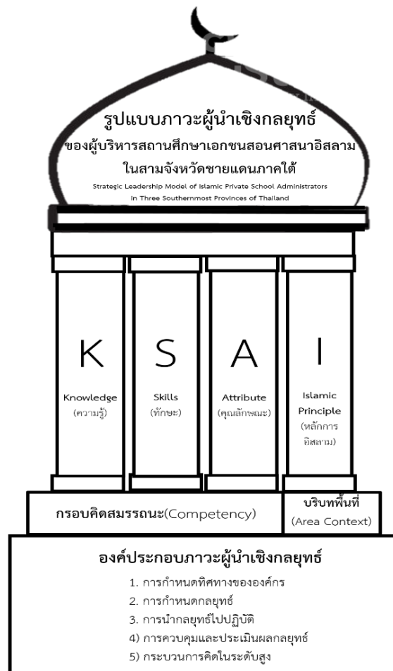
ภาพที่ 1 กรอบแนวคิดการวิจัย