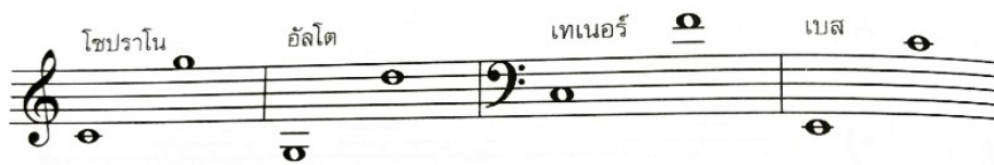
ภาพ 3 ช่วงเสียงของแต่ละแนวเสียง ที่มา: Sotiyaturak (2005)

Sotiyaturak (2005) อธิบายว่าการวางแนวเสียงสำหรับการขับร้องประสานเสียงต้องใช้การบันทึกโน้ตแบบแนวเสียงรวมเป็นหลักในลักษณะเดียวกับเพลงประสานเสียงสี่แนวหรือคอรอล (Chorale) ประกอบด้วย 4 แนวเสียง ได้แก่ แนวบนสุดเรียกว่าแนวโซปราโน (Soprano ใช้ตัวย่อ S) แนวรองลงมาเรียกว่าแนวอัลโต (Alto ใช้ตัวย่อ A) แนวถัดลงมาเรียกว่าแนวเทเนอร์ (Tenor ใช้ตัวย่อ T) และแนวล่างสุดเรียกว่าแนวเบส (Bass ใช้ตัวย่อ B) ซึ่งนิยมใช้ตัวย่อในการเรียกแนวทั้งสี่ว่า SATB ซึ่งแต่ละแนวมีระยะระหว่างแนวเสียงที่ต้องคำนึงเนื่องจากระยะที่ไม่เหมาะสมจะทำให้ความหนาแน่นระหว่างแนวขาดน้ำหนักรหรือขาดความสมดุล ในการเขียนเสียงประสานควรวางโน้ตทุกตัวอยู่ในช่วงเสียงที่กำหนด ดังภาพ 3