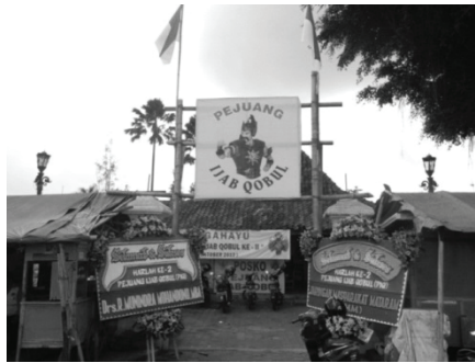
ภาพ 1 ศูนย์ประสานงานกลุ่ม Posko ซึ่งตั้งอยู่ด้านหน้าวังสุลต่าน, ที่มา: โดยผู้เขียน

ด้วยเหตุนี้ สมาคมหรือองค์กรเคลื่อนไหวเพื่อการคงสถานะพิเศษเมืองยอกยาคาร์ตาและสุลต่าน ภายใต้ชื่อว่า Posko Relawan Referendum Yogyakarta จึงได้ถือกำเนิดขึ้นอย่างเป็นทางการในวันที่ 5 ตุลาคม ปี 2010 โดยมีศูนย์ประสานงานกลางตั้งอยู่บริเวณสนามหน้าวังสุลต่าน ช่วงแรกของการก่อตั้งรับสมาชิกนั้นยังไม่ค่อยมีผู้คนเข้าร่วมมากนัก ทางแกนนำและสมาชิกของกลุ่มจึงทำการประชาสัมพันธ์ให้ผู้คนที่ได้รับทราบปัญหาด้วยสื่อและอุปกรณ์ต่างๆ อย่างเช่น แผ่นป้าย สติกเกอร์ ธงและตราสัญลักษณ์ เป็นต้น จนมีผู้คนจำนวนมากขึ้นเริ่มเข้าไปปัญหาดังกล่าวและพร้อมเข้าร่วมหรือให้การสนับสนุนกับการจัดกิจกรรมของทางกลุ่ม