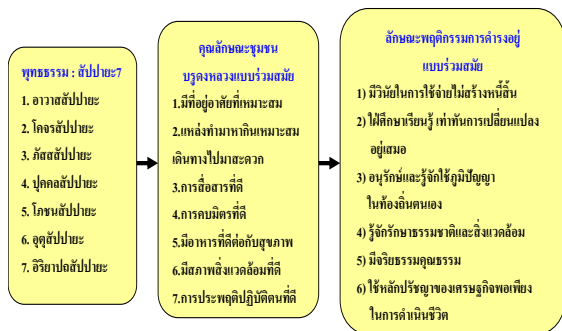
ภาพที่ 2 แสดงการสังเคราะห์คุณลักษณะตามหลัก พุทธธรรม 7 ประการ

การสื่อสาร การเปลี่ยนแปลงไปอย่างรวดเร็วนี้ทำให้ ชุมชนบรูตงหลวงมีสภาพความเป็นชุมชนลดลงมี กิจกรรมทางสังคมร่วมกันน้อยลง สถาบันทางสังคมมี แนวโน้มอ่อนแอลง การมีสัมมาคารวะและเคารพเชื่อฟัง ผู้อาวุโสมีน้อยลง มีความเสื่อมถอยทางคุณธรรม จริยธรรม คราวเรือนมีปัญหาหนี้สิน คนในชุมชนมีปัญหา ด้านสุขภาพทั้งทางกายและทางจิตใจ เยาวชนขาด วิจารณ์ญาณในการเสพย์สื่อ ประเพณีวัฒนธรรมที่ดี งามหลายอย่างอยู่ในภาวะเสี่ยงที่ใกล้จะสูญหาย การ ดำรงอัตลักษณ์ของชาติพันธุ์ถดถอยคุณลักษณะการ และดำรงอยู่แบบร่วมสมัยของชุมชนบรูตงหลวง และ คุณลักษณะพฤติกรรมของคนบรูตงหลวงที่จะสามารถ ดำรงชีวิตอยู่แบบร่วมสมัยในโลกแห่งการเปลี่ยนแปลง ได้อย่างมีความสุขสบาย มีดังนี้คือ