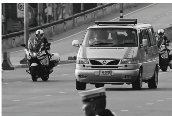
ภาพที่ 3 รถยนต์ทรงงานส่วนพระองค์ Volkswagen Transporter

อีกหนึ่งองค์คือ Volkswagen Transporter เป็นรถตู้สี่เหลี่ยมฟ้าปี 1998 ที่มีความสมถะ เรียบง่าย และเป็นรถที่ทรงโปรดมากคันหนึ่ง ส่วนเหตุผลที่มีการเลือกทรงที่หนึ่งคันนี้มาใช้ในพิธีอัญเชิญพระบรมศพ ได้มีผู้ให้คำตอบไว้ดังนี้ “รถพระที่นั่งคันนี้มีนามเรียกขานว่า “เจมส์บอนด์” เหตุผลที่ใช้รถคันนี้เป็นรถอัญเชิญพระบรมศพ คือเป็นรถที่พระองค์ทรงโปรด ด้านในรถจะเรียบง่ายมาก แทบไม่มีอะไรเลย นอกจากวิทยุเดิม ๆ ที่ติดมากับรถ แล้วก็จะมีโต๊ะเล็ก ๆ ไว้ทรงงาน สภาพของรถจะมีนายช่างประจำตัว คอยซ่อมแซมให้ตลอด [17]