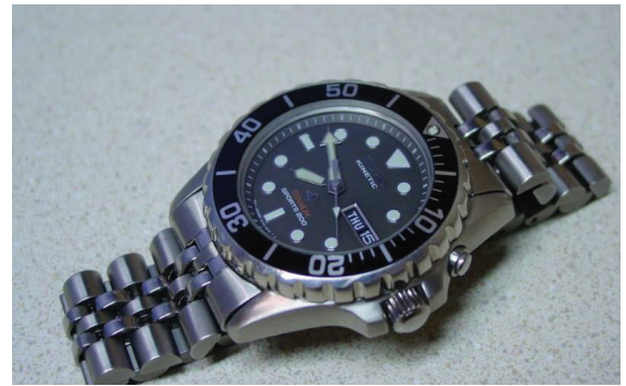
ภาพที่ 1 นาฬิกาทรงใช้ [16]

ก็เดินตรงเหมือนกันกับนาฬิกาเรือนแพง” [15] จะเห็นได้ว่าพระองค์จะให้ความสำคัญกับสิ่งของทรงใช้ที่ประโยชน์จากการใช้งานมากกว่ายี่ห้อหรือรุ่น “พระองค์ทรงไม่เห็นความจำเป็นว่าต้องใช้ของแพง หรือต้องเป็นแบรนด์เนม ไม่โปรดสวมเครื่องประดับ เช่น แหวน สร้อยคอ ของมีค่าต่าง ๆ ยกเว้นนาฬิกาคลั่งภาพในหลวงในงานพระราชพิธีฉลองสิริราชสมบัติครบ 60 ปี นาฬิกาข้อมือพระหัตถ์คือ Seiko SKJ045P นาฬิกาข้อมือระบบ Kinetic ตัวเรือนเป็นไทเทเนียม ซึ่งถือว่าเป็นนาฬิกาเรือนธรรมดาธรรมดามาก ๆ เรียกภาษาชาวบ้านคือเป็นนาฬิกาใช้งาน แสดงถึงความเรียบง่ายและสมถะของพระองค์ท่าน และทรงเป็นแบบอย่างแห่งความพอเพียงอย่างที่สุด” [16]