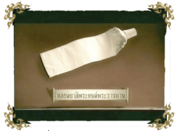
ภาพที่ 8 หลอดยาสีพระทนต์พระราชทาน

อีกแบบอย่างหนึ่งของสิ่งของทรงใช้ส่วนพระองค์ ที่แสดงถึงการบริโภคอย่างคุ้มค่า นั่นคือภาพหลอดยาสีพระทนต์ ที่ทรงใช้แล้วของพระบาทสมเด็จพระเจ้าอยู่หัว ซึ่งเราจะสังเกตเห็นว่ามีลักษณะเรียบแบบราวกับกระดาษนั้นแสดงให้เห็นว่ามีกรริด เพื่อให้ได้ตัวยาสีฟันออกมาให้หมด ทำให้เราทราบได้ว่าพระองค์ ทรงใช้ยาสีพระทนต์ดังกล่าวได้คุ้มค่าและมีประโยชน์สูงสุด โดยภาพหลอดยาสีพระทนต์ดังกล่าวมีที่มาที่น่าสนใจและน่าจะเป็นแบบอย่างที่ดีให้แก่ทุกคนดังนี้