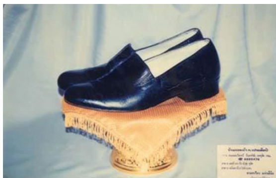
ภาพที่ 4 ฉลองพระบาท(ที่มา: Office of the Royal Development Projects Board (ORDPB). [14]

พระองค์ท่านไว้ว่าหลายคนหากทราบถึงราคาคงตกใจ เพราะคู่ละ 100 - 400 บาทเท่านั้น อีกทั้งฉลองพระบาทของพระองค์ยังถูกนำส่งไปซ่อมแล้วซ่อมอีกที่ร้านเล็กๆ ใกล้เคียง ขณะที่ข้าราชการบริพารใส่รองเท้าคู่ละ 3,000 - 4,000 บาท แต่เวลาพระองค์ทรงออกเยี่ยมราษฎรในพื้นที่ห่างไกล ที่สุดแล้ว ข้าราชการบริพารก็เดินตามพระองค์ไม่ทันอยู่ดี พระองค์ท่าน มักจะตรัสถึงสาเหตุที่ไม่จำเป็นต้องมีฉลองพระบาทมากมาย “เวลาเดิน คนเราใส่รองเท้าได้คู่เดียว” [8]