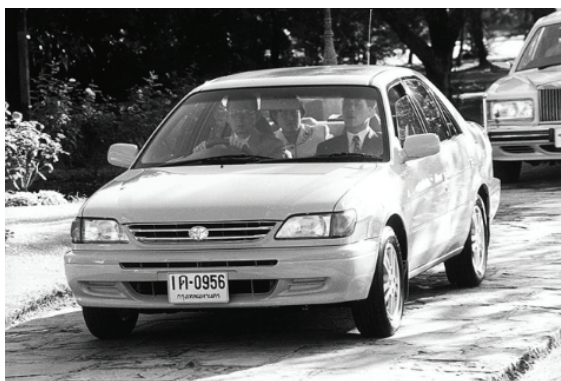
ภาพที่ 2 รถยนต์ทรงงานส่วนพระองค์ Toyota soluna

อีกหนึ่งองค์คือ Volkswagen Transporter เป็นรถตู้สี่เหลี่ยมฟ้าปี 1998 ที่มีความสมถะ เรียบง่าย และเป็นรถที่ทรงโปรดมากคันหนึ่ง ส่วนเหตุผลที่มีการเลือกทรงที่หนึ่งคันนี้มาใช้ในพิธีอัญเชิญพระบรมศพ ได้มีผู้ให้คำตอบไว้ดังนี้ “รถพระที่นั่งคันนี้มีนามเรียกขานว่า “เจมส์บอนด์” เหตุผลที่ใช้รถคันนี้เป็นรถอัญเชิญพระบรมศพ คือเป็นรถที่พระองค์ทรงโปรด ด้านในรถจะเรียบง่ายมาก แทบไม่มีอะไรเลย นอกจากวิทยุเดิม ๆ ที่ติดมากับรถ แล้วก็จะมีโต๊ะเล็ก ๆ ไว้ทรงงาน สภาพของรถจะมีนายช่างประจำตัว คอยซ่อมแซมให้ตลอด [17]