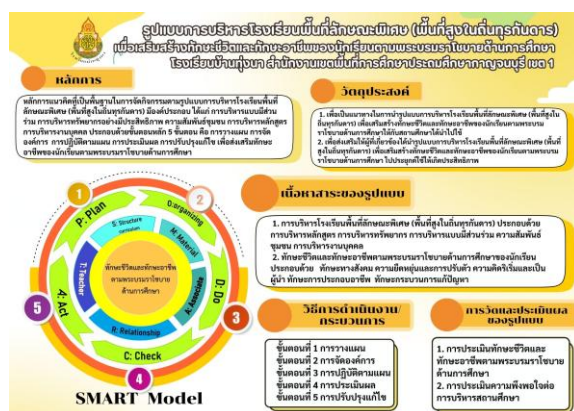
ภาพที่ 2 รูปแบบการบริหารโรงเรียนพื้นที่ลักษณะพิเศษ (พื้นที่สูงในถิ่นทุรกันดาร) เพื่อเสริมสร้างทักษะชีวิตและทักษะอาชีพของนักเรียน ตามพระบรมราโชบายด้านการศึกษา โรงเรียนบ้านหุบนา สำนักงานเขตพื้นที่การศึกษาประถมศึกษากาญจนบุรี เขต 1

2. ผลการสร้างและตรวจสอบรูปแบบการบริหารโรงเรียนพื้นที่ลักษณะพิเศษ (พื้นที่สูงในถิ่นทุรกันดาร) เพื่อเสริมสร้างทักษะชีวิต และทักษะอาชีพของนักเรียนตามพระบรมราโชบาย ด้านการศึกษา พบว่า องค์ประกอบของรูปแบบ ประกอบไปด้วย 5 ส่วนดังนี้ ส่วนที่ 1 หลักการของรูปแบบ ส่วนที่ 2 วัตถุประสงค์ของรูปแบบ ส่วนที่ 3 เนื้อหาสาระของรูปแบบ ส่วนที่ 4 วิธีการดำเนินงาน/กระบวนการ ของรูปแบบ และส่วนที่ 5 การวัดและประเมินผลของรูปแบบ องค์ประกอบการบริหารโรงเรียนพื้นที่ลักษณะพิเศษ (พื้นที่สูงในถิ่นทุรกันดาร) ประกอบไปด้วย 5 องค์ประกอบ ได้แก่ 1) การบริหารหลักสูตร 2) การบริหารทรัพยากร 3) การบริหารแบบมีส่วนร่วม 4) ความสัมพันธ์ กับชุมชน และ 5) การบริหารงานบุคคล กระบวนการบริหารสถานศึกษา มี 5 ขั้นตอน ได้แก่ ขั้นตอนที่ 1 การวางแผน ขั้นตอนที่ 2 การจัดองค์การ ขั้นตอนที่ 3 การปฏิบัติตามแผน ขั้นตอนที่ 4 การประเมินผล ขั้นตอนที่ 5 การปรับปรุงแก้ไข และทักษะชีวิตและทักษะอาชีพ ตามพระบรมราโชบายด้านการศึกษา ประกอบไปด้วย 5 ด้าน ได้แก่ 1) ทักษะทางสังคม 2) ความยืดหยุ่นและการปรับตัว 3) ความคิดริเริ่ม และเป็นผู้นำ 4) ทักษะการประกอบอาชีพ ตามพระบรมราโชบายด้านการศึกษา 5) ทักษะกระบวนการแก้ปัญหา