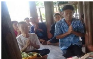
ภาพที่ 5 ผู้ที่ทำการแก้บนกราบไหว้เจ้าพ่อม้าขาว

ขั้นที่ 2 ผู้ที่จะทำการแก้บนกราบไหว้ ผู้ที่ทำการแก้บนมีการกราบไหว้ เจ้าพ่อก่อนที่จะมีการถวายของ