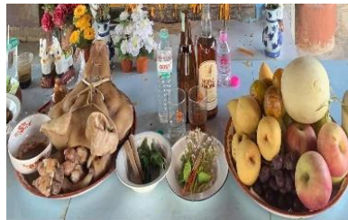
ภาพที่ 4 วัสดุที่ใช้ในการถวาย

ขั้นที่ 1 เตรียมวัสดุที่จะใช้ในการถวาย ที่จะทำการแก้บนจะเตรียม หัวหมู เหล้า ผลไม้ บุหรี่ ข้าวตอกดอกไม้ เพื่อที่จะนำไปถวาย