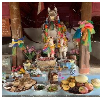
ภาพที่ 3 เครื่องประกอบพิธีกรรม

เครื่องประกอบพิธีกรรมการแก้บน เป็นเครื่องสังเวยที่ใช้ในการแก้บนเจ้าพ่อม้าขาว เป็นสิ่งที่ชาวบ้านได้ทำเพื่อแสดงการตอบแทนต่อเจ้าพ่อที่ช่วยในสิ่งที่ตนเองได้บนบานศาลกล่าวไว้ และเมื่อประสบความสำเร็จหรือได้ตามสิ่งที่ตนเองต้องการจึงมีการแก้บนเพื่อให้ไม่มีสัญญาต่อกัน