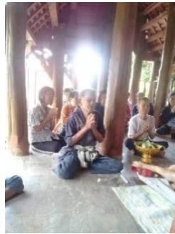
ภาพที่ 2 ผู้ประกอบพิธีกรรม

พิธีกรรมการแก้บนเจ้าพ่อม้าขาว เป็นพิธีกรรมสำคัญที่จะต้องมีการแก้บนตามคำสัญญาที่บนบานศาลกล่าวต่อเจ้าพ่อม้าขาว ในการทำพิธีนี้จะมี คือ ผู้ประกอบพิธีกรรม ผู้ที่จะทำการแก้บนรวมทั้งเด็กและผู้ใหญ่ การทำพิธีจะต้องอาศัยผู้ประกอบพิธีกรรมโดยมีพ่อหนานเป็นผู้ประกอบพิธีกรรม (พ่อหนาน คือ ผู้ที่สึกออกจากการบวชเป็นพระภิกษุมานแล้ว) เพื่อให้ผู้ประกอบพิธีกรรมถวายของแก้บนแก่เจ้าพ่อตามลำดับขั้นตอนของพิธีกรรมการแก้บน เพื่อให้สำเร็จลุล่วงไปด้วยดีและไม่มีสัญญาต่อกัน