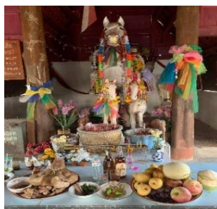
ภาพที่ 6 การถวายของที่จะทำการแก้บน

ขั้นที่ 3 ถวายของแก้บน ผู้ที่ทำการแก้บนถวายของแก้บนแก่เจ้าพ่อม้าขาว เพื่อให้ตนเองและครอบครัว มีความสุขความเจริญ