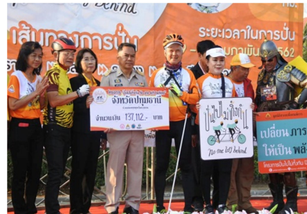
Figure 2 Pun pai mai ting kun project.