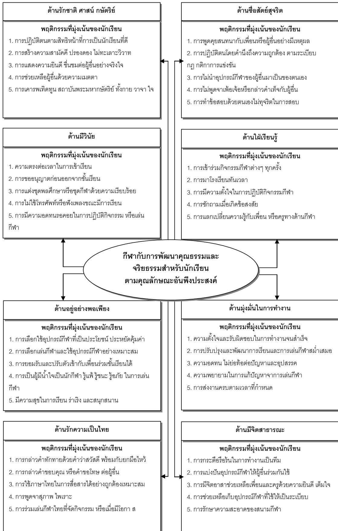
แผนภาพที่ 2 กีฬากับการพัฒนาคุณธรรมและจริยธรรมสำหรับนักเรียน ตามคุณลักษณะอันพึงประสงค์ 8 ประการ หลักสูตรแกนกลางการศึกษาขั้นพื้นฐาน พุทธศักราช 2551