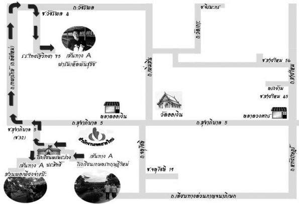
ภาพที่ 1 การท่องเที่ยวเชิงเกษตรโปรแกรม A

พืชผักผลไม้และผักสวนครัว 7 ไร่ ปลูกไว้ติดกับพื้นที่พักอาศัยเพื่อเก็บกินผลผลิตโดยไม่ต้องซื้อ หากมีผลผลิตมากเหลือกินเหลือใช้ จึงนำไปขายยึดหลักการทำเกษตรกรรมตามแนวทางเศรษฐกิจพอเพียง นอกจากนี้ยังทำเครื่องมือทางการเกษตรไว้ใช้เองและแบ่งปันเพื่อนบ้าน โดยใช้วัสดุในพื้นที่ เช่น เครื่องเก็บผลไม้ ไม้กวาด เป็นต้น