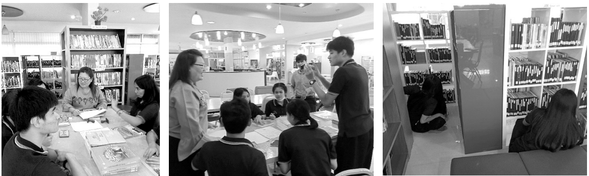
ภาพที่ 3 การร่วมกันฝึกปฏิบัติงานห้องสมุดของนักศึกษาปกติและบกพร่องทางการได้ยิน

เป็นการฝึกทักษะกระบวนการกลุ่มโดยผู้เรียน ในขั้นนี้กลุ่มเพื่อนจะมีบทบาทสำคัญมาก โดยผู้เรียนเองจะทำหน้าที่ช่วยเหลือ ทบทวนความรู้ให้กับเพื่อน การฝึกปฏิบัติเกี่ยวกับการทำงานห้องสมุดทั้งในห้องเรียน และห้องสมุดประเภทต่างๆ ในขั้นตอนนี้จะมีการประชุมแบ่งหน้าที่ความรับผิดชอบในกลุ่ม ซักถามให้เกิดความเข้าใจระหว่างสมาชิกในกลุ่ม ก่อนจับคู่กันปฏิบัติงานที่ผู้เรียนทั้งสองฝ่ายต้องแบ่งปันความรู้ ตรวจสอบและให้คำแนะนำเพื่อนในการทำงานโดยมีบรรณารักษ์และล่ามภาษามือให้คำแนะนำและอธิบายเพื่อให้ผู้เรียนที่มีความบกพร่องทางการได้ยินเกิดความเข้าใจอย่างชัดเจน