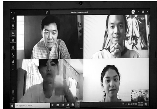
ภาพที่ 2 บริการช่วยเหลือนักศึกษาที่มีความบกพร่องทางการได้ยิน

หลักสูตรศิลปศาสตรบัณฑิต สาขาบรรณารักษศาสตร์และสารสนเทศศาสตร์ มหาวิทยาลัยสวนดุสิต เป็นหนึ่งหลักสูตรที่รับผู้ที่มีความบกพร่องทางการได้ยินเรียนร่วม ผู้เขียนบทความได้รับมอบหมายให้สอนรายวิชาเฉพาะของวิชาซีพบรรณารักษฯ เน้นการวิเคราะห์เนื้อหาและการฝึกปฏิบัติในงานห้องสมุด และจากการจัดการเรียนการสอนในปีการศึกษา 2/2561 ที่ผ่านมา นักศึกษาที่มีความบกพร่องทางการได้ยินส่วนใหญ่มีคะแนนผลการเรียนค่อนข้างต่ำ เมื่อสอบถามสาเหตุปัญหา พบว่า เกิดจากความเข้าใจในการสื่อสารไม่ตรงกัน ไม่เข้าใจวิธีการวิเคราะห์และจัดกลุ่มสารสนเทศ ขั้นตอนในการปฏิบัติงานที่ถูกต้องเพราะเมื่อทำงานกลุ่มร่วมกับเพื่อนปกติ ผู้เรียนที่บกพร่องทางการได้ยินทำไม่ได้หรือทำผิด เพื่อนคนอื่นๆ จะเป็นผู้แก้ไขให้โดยไม่มีการบอกถึงข้อบกพร่องของชิ้นงาน ถึงแม้จะสอบถามผู้สอนและนำไปแก้ไขก็ยังไม่เข้าใจวิธีการปฏิบัติอย่างแท้จริง จาก