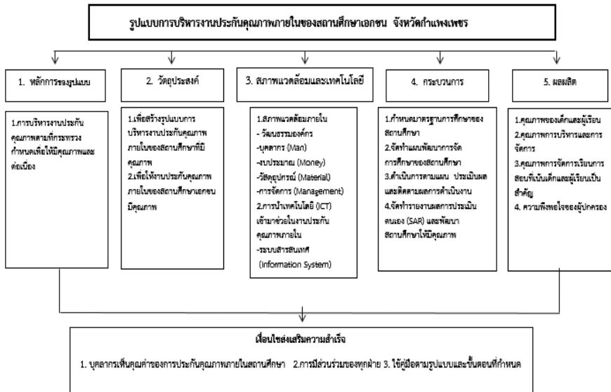
รูปภาพที่ 2 แสดงรูปแบบการบริหารงานประกันคุณภาพภายในของสถานศึกษาเอกชน จังหวัดกำแพงเพชร

โครงสร้างรูปแบบการบริหารงานประกันคุณภาพภายในของสถานศึกษาเอกชน จังหวัดกำแพงเพชร 4) บรรณานุกรม