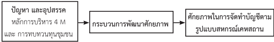
รูปภาพที่ 1 กรอบแนวคิดโครงการวิจัยการพัฒนาศักยภาพชุมชนในการจัดทำบัญชีตามรูปแบบของสหกรณ์เคหสถานเพื่อรองรับโครงการบ้านมั่นคง กรุงเทพมหานคร