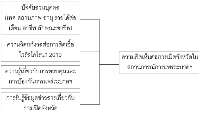
รูปภาพที่ 1 กรอบแนวคิดการวิจัย