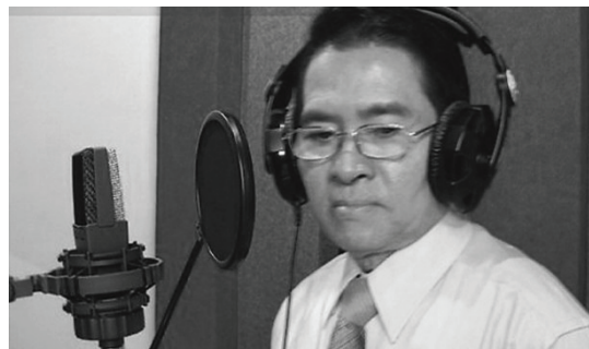
เพลิน พรหมแดน

จะเห็นว่าเนื้อหาของบทเพลงนี้ได้สะท้อนให้เห็นความสุขความสบายใจของชวานา ภาพแห่งความสุขนี้ก่อเกิดขึ้นหลังจากชวานาได้ผ่านพ้นช่วงเวลาการทำงานอันหนักหน่วงแล้ว ภารกิจเมื่อโดนปลดเปลื้องความโล่ง เบา สบาย จึงเกิดขึ้น ชวานาจึงสำแดงความสบายใจผ่านการร้องรำทำเพลง ดังปรากฏในเนื้อเพลงว่า