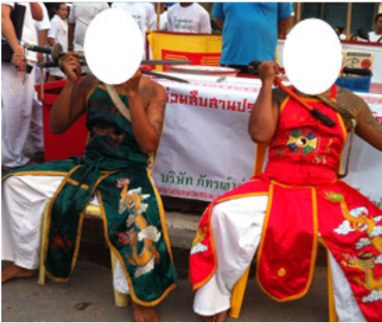
ภาพ 1 ภาพต่อและม้าทรงในพิธีถือศีลกินเจ

เจ้าพ่อกวนอู หรือเทพเจ้าองค์ต่าง ๆ ในศาลแห่งนั้น” พี่เอ็กซ์, (สัมภาษณ์, 18 พฤษภาคม 2565) ส่วนนี้เอง เป็นสิ่งที่น่าสนใจสำหรับผมมากเช่นกัน กล่าวคือ เนื่องจากการฝังตัวในชุมชนแห่งพิธีกรรมแห่งนี้ทำให้ทราบว่า การคัดเลือกต่อนั้นมักเกี่ยวข้องกับลักษณะทางกายภาพที่เด่นชัด อาทิ เทพเจ้ากวนอูมักใส่สีเขียว หรือ เทพเจ้านางามักใส่สีแดง เป็นต้น ดังภาพ 1