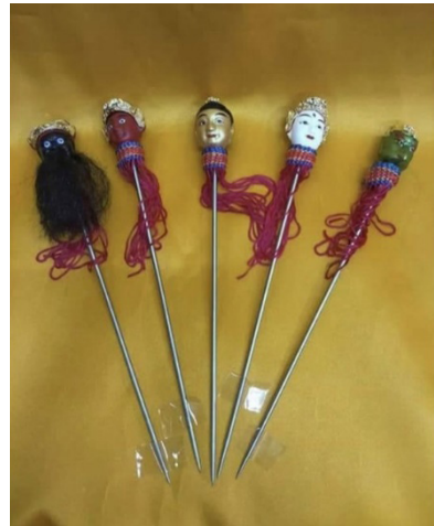
ภาพ 3 เหล็กห้าหัวมณฑล หรือ โหงวเอี้ยห้า (五營頭) ที่มา โดยผู้วิจัย