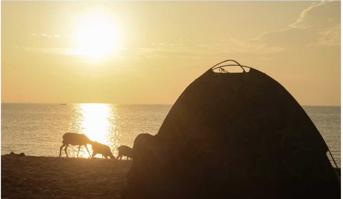
ภาพ 2 ภาพบรรยากาศการตั้งแคมป์ ณ หาดแหลมตาชี

ในวันที่ท้องฟ้ายามเช้าปลอดโปร่งสดใสไร้เมฆบัง นักท่องเที่ยวจะมองเห็นพระอาทิตย์ดวงโตโผล่ขึ้นจากท้องทะเลขึ้นมาทักทาย และตกลงที่เดิมอีกครั้ง ในยามเย็น ทำให้เราสามารถมองเห็นได้โดยไม่ต้องเคลื่อนย้ายไปไหน เป็นอีกเหตุผลหนึ่งที่ทำให้หาดแหลมตาชีกลายเป็นหาดที่เหมาะสมแก่การไปกางเต็นท์เพื่อพักผ่อนในวันว่าง ๆ เพราะที่นี่เป็นหาดที่มีต้นไม้คอยให้บรรยากาศร่มรื่นตลอดแนวชายฝั่ง