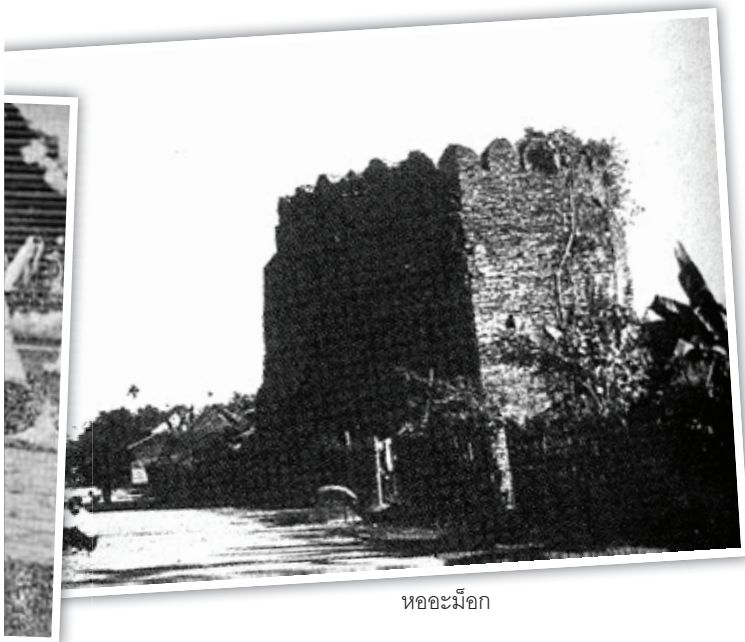
หอคอยม็อก

ในยุคสมัยที่สังคมไทยยังไม่มีสื่อโทรทัศน์ ชาวบ้านจะผ่อนคลายอิริยาบถภายหลังว่างจากการทำงานด้วยการชุมนุมกันเพื่อพบปะพูดคุย ทำกิจกรรมที่เป็นสาธารณประโยชน์ร่วมกัน รวมไปถึงการร้องรำทำเพลง การละเล่นต่างๆ ตามแต่ความนิยมในยุคสมัย ภายหลังสังคมไทยเริ่มพัฒนามากขึ้นจนเข้าสู่ช่วงปลายรัชกาลที่ 5 ต่อเนื่องกับรัชกาลที่ 6 ตั้งแต่ พ.ศ. 2443 ถึง พ.ศ. 2469 อันเป็นยุคเริ่มแรกของการเขียนนวนิยายและเรื่องสั้น วงการการเขียนของไทยได้เปลี่ยนจากการ