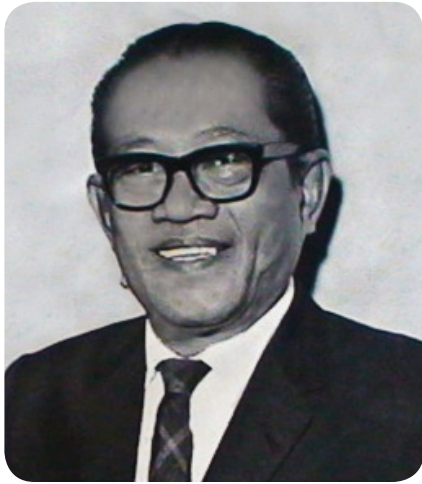
หม่อม เวชกร นักเขียนนิยายผีคนแรกของประเทศไทย