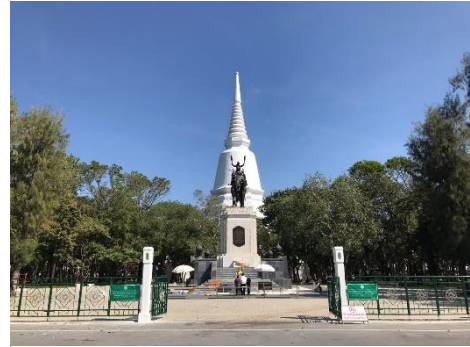
ภาพ 1 พระบรมราชานุสาวรีย์และพระเจดีย์

2.1.2. พระบรมรูปสมเด็จพระนเรศวรมหาราชทรงพระศขาธาร ออกศึก ขนาดเท่าครึ่งของพระองค์จริง หล่อด้วยทองสัมฤทธิ์ กว้าง 2.90 เมตร ยาว 5.45 เมตร สูง 7.00 เมตร