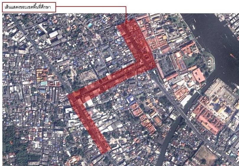
ภาพ 3 ภาพแผนที่แสดงพื้นที่ศึกษาตั้งแต่สถานีรถไฟใต้ดินอีสรภาพจนถึงวัดอรุณา

พื้นที่ศึกษาเฉพาะพื้นที่เศรษฐกิจสองข้างทางที่มีที่ตั้งประชิดกับถนนสายหลัก ตั้งแต่สถานีรถไฟใต้ดิน MRT อีสรภาพ ไปจนถึงสามแยกไฟฉายไปทางทิศตะวันออกตามถนนวังเดิมไปจนถึงวัดอรุณา เป็นพื้นที่ที่มีความหนาแน่นของธุรกิจสองข้างทางและคนในพื้นที่พร้อมที่จะปรับธุรกิจดั้งเดิมเป็นธุรกิจที่สามารถสร้างรายได้มากขึ้นกว่าเดิม หรือรูปแบบการประกอบธุรกิจมีความสบายกว่าเดิม