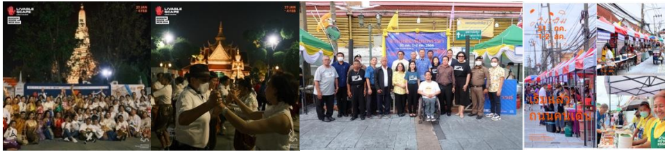
ภาพ 1 ภาพแสดงกิจกรรม Bangkok Design Week และงานหล่อเทียนพรรษา ย่านวังเดิมเขตบางกอกใหญ่

เช่น งานหล่อเทียนพรรษา การศึกษาแนวทางส่งเสริมการปรับปรุงธุรกิจดั้งเดิมเพื่อเป็นธุรกิจสร้างสรรค์ในย่านชุมชนเก่า กรณีศึกษา ย่านวังเดิม (ถนนวังเดิม) สามารถนำไปประยุกต์ใช้ต่อยอดในพื้นที่อื่น ๆ ได้ เช่น ย่านกุฎีจีน เขตธนบุรี และย่านตลาดพลู เขตธนบุรี สามารถนำมาปรับใช้ได้เช่นเดียวกัน