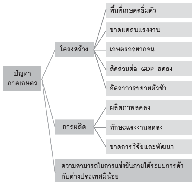
ภาพที่ 1 ปัญหาของภาคเกษตรไทยในปัจจุบัน

หมายเหตุ: สรุปภาพรวมของปัญหาภาคเกษตรไทย เพื่อนำไปสู่ความจำเป็นของการพัฒนาการเกษตรเชิงการค้าในบทความนี้.