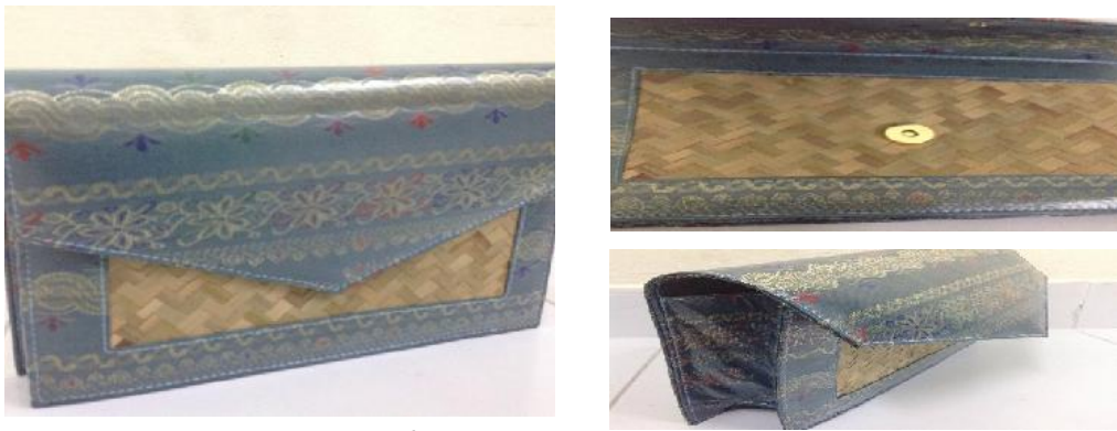
ภาพที่ กระเป๋าผ้าไหมจากวัสดุผสมกระดาษจูด