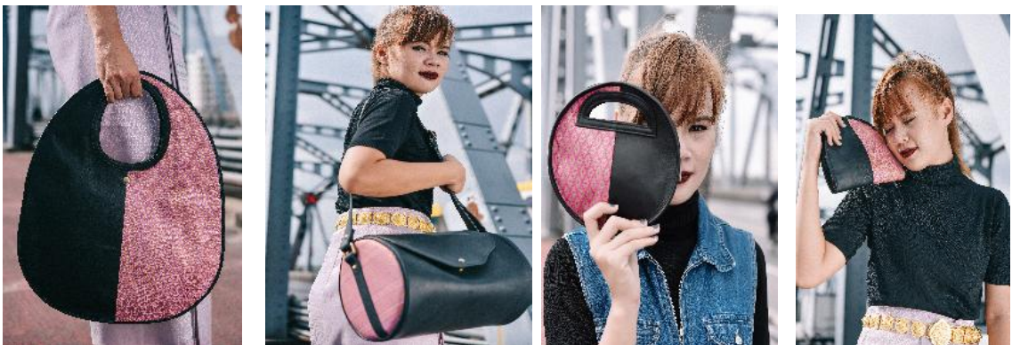
ต้นแบบผลิตภัณฑ์ ชุดที่ 1