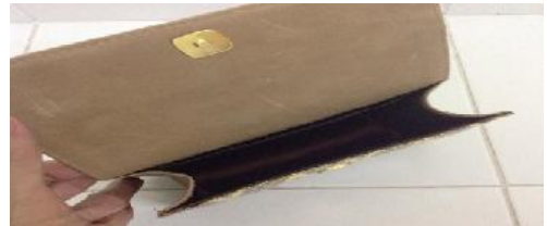
ภาพที่ กระเป๋าผ้าไหมกับวัสดุผสมหนัง