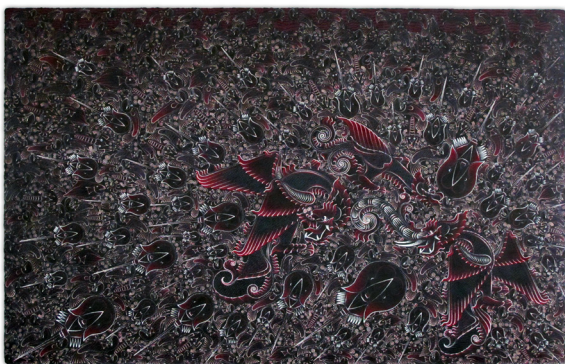
ภาพที่ 10 แสดงภาพตัวอย่างผลงานจิตรกรรมชุด รูปลักษณ์ท้องถิ่นปัตตานี 11/2550 สีอะครายลิกบนเยื่อกระดาษทำมือ ขนาด 320 x 500 เซนติเมตร

นอกจากนี้ข้าพเจ้าได้กำหนดโครงสร้างโดยรวมของภาพผลงานด้วยการระบายสีรองพื้น ใช้สีดำตัดเส้นด้วยวิธีการหยดสีรูปทรงทั้งหมดในผลงาน แล้วใช้สีขาวหยดสีไล่น้ำหนัก ลงน้ำหนักสุดท้ายด้วยสีคู่สี สร้างค่าน้ำหนักของรูปทรงตัวภาพต่างๆ ด้วยโครงสร้างเดียวกัน ทำให้ผลงานสร้างสรรค์ชิ้นนี้มีความกลมกลืน ตรงตามอารมณ์ความรู้สึกที่ต้องการนำเสนอ