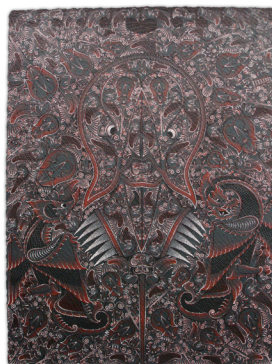
ภาพที่ 11 แสดงภาพตัวอย่างผลงานจิตรกรรมชุด รูปลักษณ์ท้องถิ่นปัตตานี 10/2550 สีอะครายลิกบนเยื่อกระดาษทำมือ ขนาด 150 x 200 เซนติเมตร