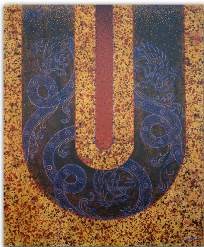
ภาพที่ 7 แสดงภาพตัวอย่างผลงานจิตรกรรมชุด สี สันจาก ท้องถิ่น 10/2550 สีอะครายลิกบนเยื่อกระดาษทำมือ ขนาด 100 x 120 เซนติเมตร

ผลงานชุดนี้เป็นการสร้างสรรค์ผลงานที่พัฒนาต่อจากผลงานสร้างสรรค์ชุดรูปลักษณะจากท้องถิ่น ลักษณะของผลงานชุดนี้ ข้าพเจ้าได้มีการพัฒนารูปแบบและเทคนิคที่มีที่ความต่างไปจากเดิม โดยเฉพาะลักษณะของการคลี่คลายรูปทรงและลวดลายรวมถึงเทคนิคการใช้สีลงบนกระดาษ ซึ่งได้รับแรงบันดาลใจจากเรือกอลและที่มีการประดับลวดลายจิตรกรรมที่มีความแตกต่างจากเรือในจังหวัดอื่นๆที่มีการใช้เรือเป็นยานพาหนะในการประกอบอาชีพประมง โดยเรือกอลและมีความงดงามและเป็นเอกลักษณ์เฉพาะถิ่น เนื่องด้วยสภาพของวิถีชีวิตในพื้นที่ มีการใช้สีสันเป็นส่วนเชื่อมโยงกับการดำรงชีวิต ไม่ว่าจะเป็น อาหารการกิน ที่มีรสจัด และมีสีสันที่แปลกตา เครื่องแต่งกาย ก็จะมีลักษณะการใช้สีสันจุดฉาด มีสีสันสดใส ซึ่งเป็นเรื่องราวที่มีความงดงามด้วยภูมิปัญญาท้องถิ่น ผลงานการสร้างสรรค์ชุดนี้ได้ใช้สัญลักษณ์รูปทรงของเรือและรูปทรงของลวดลาย เป็นสื่อทางรูปแบบในการแสดงออกของกรอบแนวคิด ซึ่งในการสร้างสรรค์ผลงานในครั้งนี้ นับว่าเป็นการค้นหาแนวทางในการแสดงออก ภายใต้กรอบแห่งการสร้างสรรค์ผลงานจิตรกรรม ที่ยังคงความเป็นลักษณะเฉพาะตน และบันทึกผลการสร้างสรรค์ผลงานอย่างเป็นระบบ