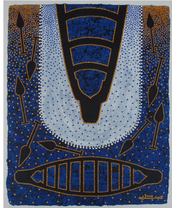
ภาพที่ 8 แสดงภาพตัวอย่างผลงานจิตรกรรมชุด สี สันจาก ท้องถิ่น 13/2550 สีอะครายลิกบนเยื่อกระดาษทำมือ ขนาด 49 x 60 เซนติเมตร