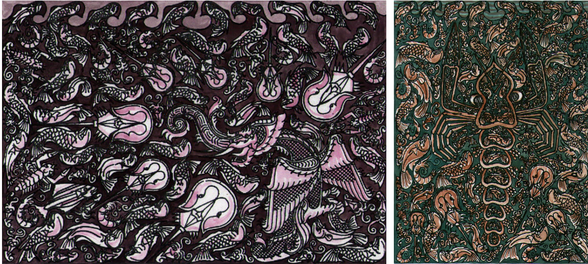
ภาพที่ 14 แสดงภาพตัวอย่างภาพแบบร่างระยะที่ 2 เป็นภาพแบบร่างซึ่งเน้นโครงสร้าง ของสีส่วนรวมของภาพเพื่อเชื่อมโยงโครงสร้างของเรื่องกับรูปทรงรวมถึงความเหมาะสมกลมกลืนอย่างมีเอกภาพของบรรยากาศสีที่ใช้ในการสร้างสรรค์

ประมงซึ่งใช้เรือกอและเป็นยานพาหนะ ทั้งนี้ เนื่องจากในพื้นที่จังหวัดปัตตานีมีพื้นที่ติดทะเลเป็นส่วนใหญ่ จึงมีการประกอบอาชีพประมงโดยใช้เรือกอและเป็นยานพาหนะในการออกหาปลามาตั้งแต่สมัยบรรพบุรุษ ซึ่งต่อมาได้มีการปรับตัวลวดลายบนเรือกอและ โดยฝีมือช่างพื้นบ้านซึ่งมีทักษะและประสบการณ์ในการเขียน