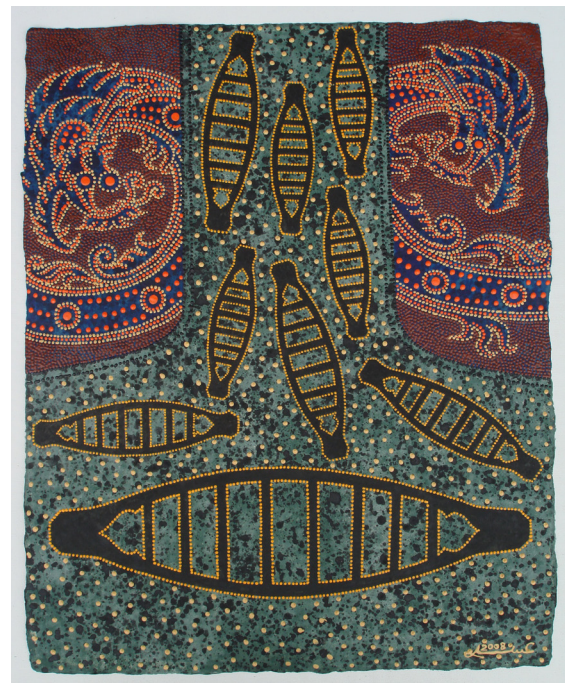
ภาพที่ 9 แสดงภาพตัวอย่างผลงานจิตรกรรมชุด สี สันจาก ท้องถิ่น 16/2550 สีอะครายลิกบนเยื่อกระดาษทำมือ ขนาด 49 x 60 เซนติเมตร