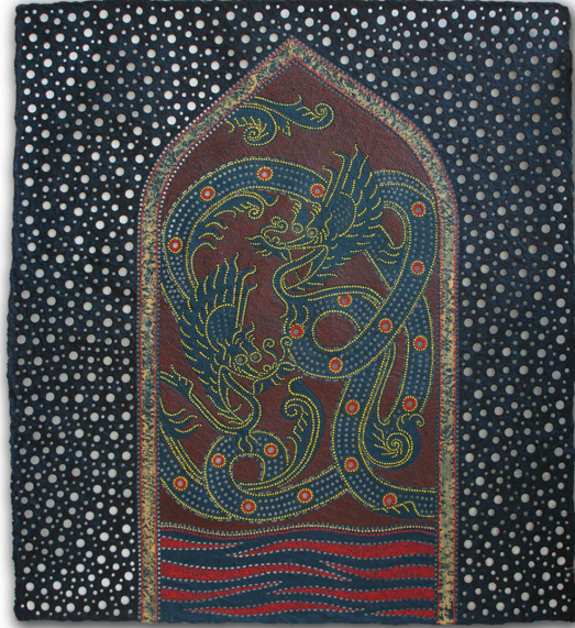
ภาพที่ 5 แสดงภาพตัวอย่างผลงานจิตรกรรมชุด รูปลักษณ์จาก ท้องถิ่น 13/2550 สีอะครายลิกบนเยื่อกระดาษทำมือ ขนาด 97 x 108 เซนติเมตร