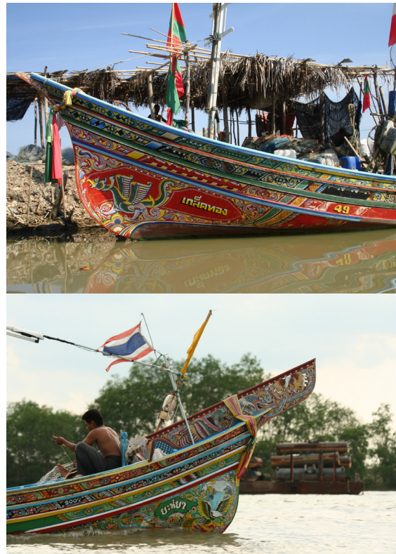
ภาพที่ 1 แสดงภาพตัวอย่างเรือกอลและที่ใช้เป็นยานพาหนะประกอบอาชีพประมงของชาวบ้านในจังหวัดปัตตานี

ทางศิลปะ โดยการใช้สัญลักษณ์ของลวดลายบนเรือกอลและเป็นสื่อการแสดงออกทางจิตรกรรมด้วยวัสดุและกรรมวิธีที่เป็นลักษณะเฉพาะตัวของข้าพเจ้า