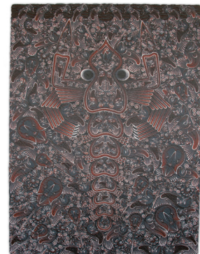
ภาพที่ 12 แสดงภาพตัวอย่างผลงานจิตรกรรมชุด รูปลักษณ์ท้องถิ่นปัตตานี 14/2550 สีอะครายลิกบนเยื่อกระดาษทำมือ ขนาด 150 x 200 เซนติเมตร