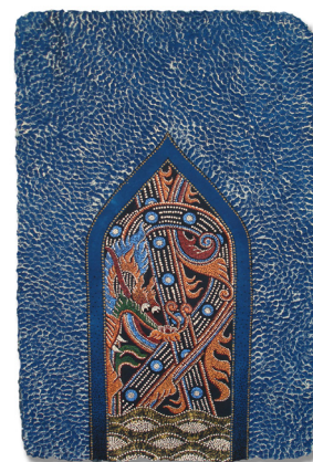
ภาพที่ 2 แสดงภาพตัวอย่างผลงานจิตรกรรมชุด จิตรกรรมวัสดุผสมที่ได้รับแรงบันดาลใจจากลวดลายเรือกอลและ 35/2549

สื่อะครายลิกบนเยื่อกระดาษทำมือ ขนาด 130 x 207 เซนติเมตร