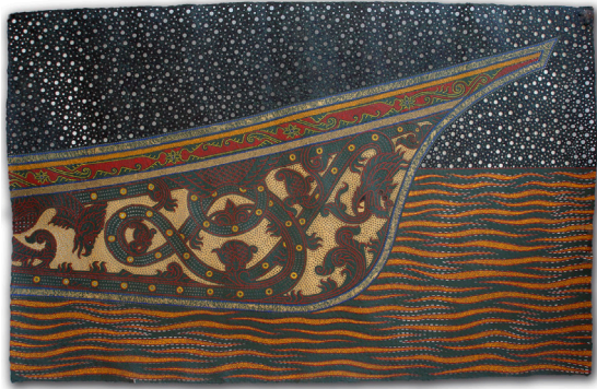
ภาพที่ 4 แสดงภาพตัวอย่างผลงานจิตรกรรมชุด รูปลักษณ์จาก ท้องถิ่น 10/2550 สีอะครายลิกบนเยื่อกระดาษทำมือ ขนาด 135 x 211 เซนติเมตร

ผลงานชุดนี้เป็นการสร้างสรรค์ผลงานต่อเนื่องจากผลงานจิตรกรรมชุด จิตรกรรมวัสดุผสมที่ได้รับแรงบันดาลใจจากลวดลายเรือกอกและ ลักษณะของผลงานชุดนี้ ข้าพเจ้าต้องการนำเสนอรูปแบบและเทคนิคที่มีการพัฒนาไปจากเดิม โดยเฉพาะลักษณะของการใช้สีและเทคนิคการตอกกระดาษที่ได้รับอิทธิพลมาจากเทคนิคการตอกหนังตะลุง ผลงานชุดนี้ได้รับแรงบันดาลใจจากเรือกอกและที่มีการประดับลวดลายจิตรกรรมทั้งดงามและสถาปัตยกรรมท้องถิ่นที่เป็นโตมโคงค์ของมัสยิดตลอดจนได้รับแรงบันดาลใจจากกรีซ ซึ่งเป็นอาวูร์ที่มีรูปแบบการแกะสลักลวดลายประดับและรูปทรงที่สวยงามบ่งบอกถึงความเป็นเอกลักษณ์ท้องถิ่น เห็นถึงความประณีตอ่อนช้อย ของผู้คนในพื้นที่ ผลงานสร้างสรรค์ชุดนี้ ได้ใช้รูปทรงดังกล่าวเป็นสื่อทางรูปแบบในการแสดงออกของกรอบแนวคิด ซึ่งในการสร้างสรรค์ผลงานในครั้งนี้ นับว่าเป็นการค้นหาแนวทางในการแสดงออก ภายใต้กรอบแห่งการสร้างสรรค์ผลงานจิตรกรรมวัสดุผสม ที่ยังคงความเป็นลักษณะเฉพาะตน และบันทึกผลการสร้างสรรค์ผลงานอย่างเป็นระบบ