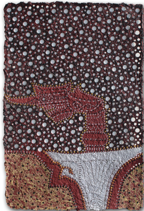
ภาพที่ 6 แสดงภาพตัวอย่างผลงานจิตรกรรมชุด รูปลักษณ์จาก ท้องถิ่น 16/2550 สีอะครายลิกบนเยื่อกระดาษทำมือ ขนาด 38 x 56 เซนติเมตร