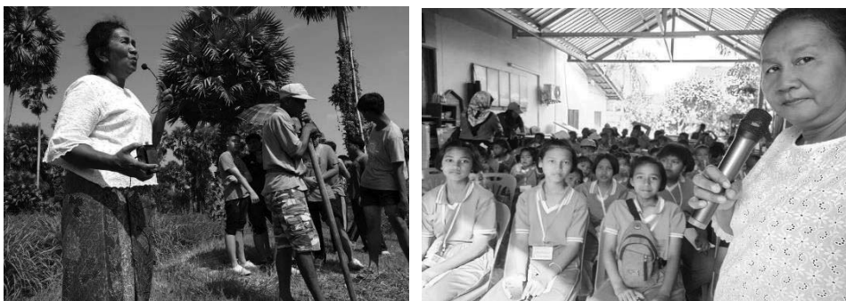
ภาพที่ 2 ปราชญ์ท้องถิ่นในฐานะการเป็นวิทยากร

การส่งเสริมบทบาทปราชญ์ท้องถิ่นที่มีความรู้ด้านภูมิปัญญาตาลโตตนโดยทั้ง 4 กลุ่มอาชีพได้มีการส่งเสริมปราชญ์ท้องถิ่นในฐานะการเป็นวิทยากร ซึ่งส่วนใหญ่เป็นประธานของกลุ่มอาชีพเพราะเป็นคนที่มีความรู้ที่เกี่ยวข้องกับภูมิปัญญาตาลโตตนไว้มากมายมีการจัดระเบียบและขั้นตอนในการถ่ายทอดความรู้ เพราะฉะนั้นการส่งเสริมบทบาทปราชญ์ท้องถิ่น เพื่อให้ปราชญ์ท้องถิ่นสามารถถ่ายทอดความรู้ที่เกี่ยวข้องกับภูมิปัญญาตาลโตตนได้อย่างเต็มที่ ส่งผลให้คนรุ่นใหม่ตระหนักในภูมิปัญญาท้องถิ่นที่มีมาตั้งแต่บรรพบุรุษ เพื่อให้มีการสืบสานต่อยอดต่อไปได้ในอนาคตและเนื่องจากสถานการณ์ปัจจุบันคนรุ่นใหม่เห็นความสำคัญกับภูมิปัญญาท้องถิ่นน้อยลงปราชญ์ท้องถิ่นจึงมีส่วนสำคัญในการเก็บรักษาองค์ความรู้ และเปิดโอกาสให้คนรุ่นใหม่ได้เข้ามาศึกษาภูมิปัญญาดั้งเดิมของคนในพื้นที่อำเภอสังขละบุรี เพื่อทำให้องค์ความรู้ภูมิปัญญาตาลโตตนยังคงอยู่ท่ามกลางการเปลี่ยนแปลงของสังคมในปัจจุบัน