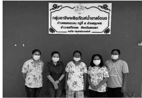
ภาพที่ 1 ศูนย์การเรียนรู้ชุมชนสปู่จากตาลโตนด และ ศูนย์การเรียนรู้ชุมชนน้ำตาลโตนดผง